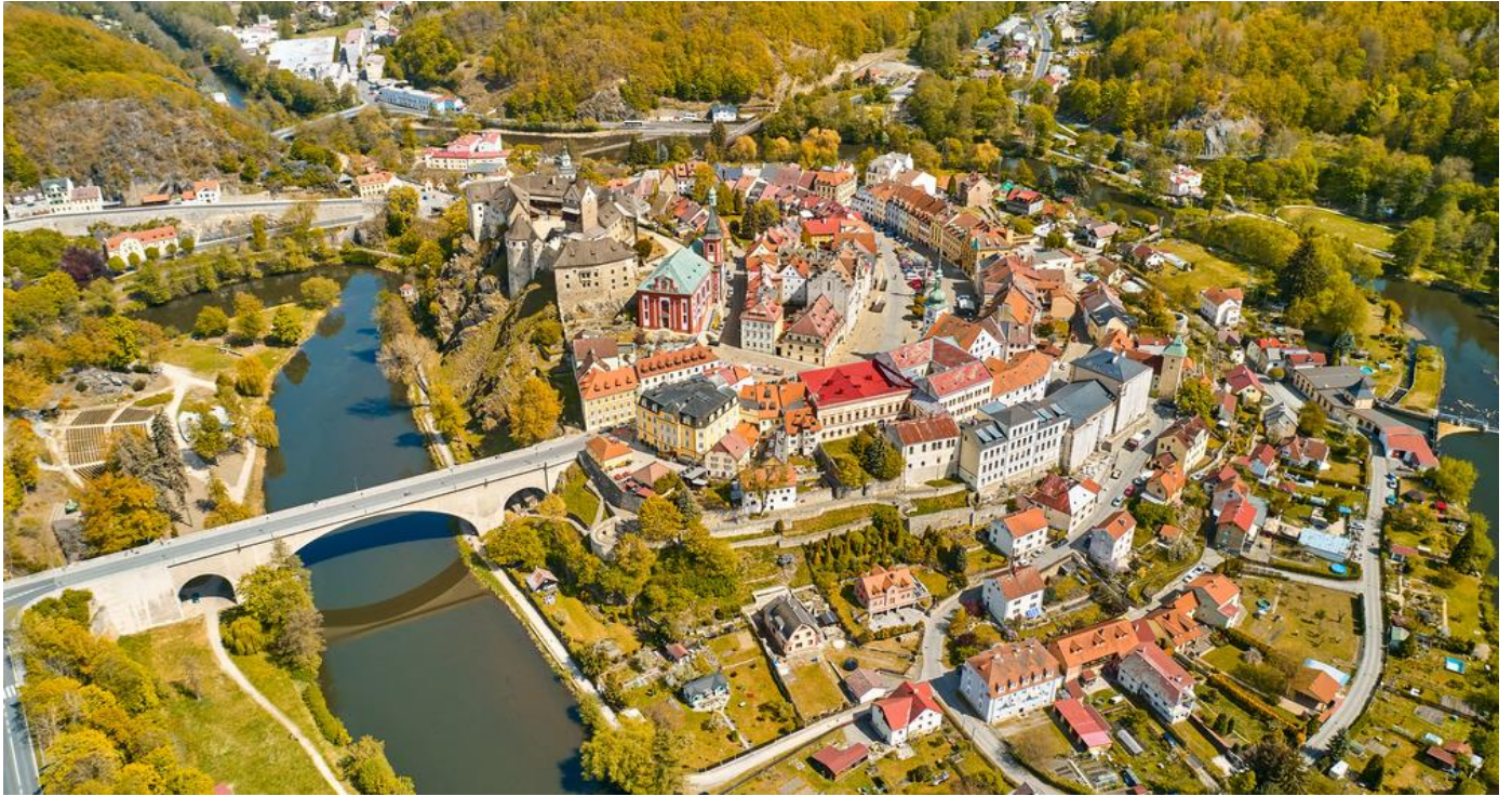
นำท่านเดินชมเมืองที่สวยงามน่ารัก

ซึ่งหมายถึงข้อศอก อันเนื่องมาจากลักษณะทางภูมิศาสตร์ของเมืองตั้งอยู่บนเนินเขาบริเวณหักศอกของแม่น้ำโอเร่ ทำให้เมืองมีแม่น้ำโอบล้อมทั้ง 3 ด้าน ซึ่งถือเป็นชัยภูมิที่ดี เป็นเมืองที่เคยถูกปกครองโดย ลักแซมเบอร์ก สวีเดน และออสเตรีย นำท่านถ่ายรูปกับปราสาทโลเกต ปราสาทสไตล์โกธิค อายุกว่า 800 ปี ที่ตั้งเด่นเป็นสัญลักษณ์ของเมือง