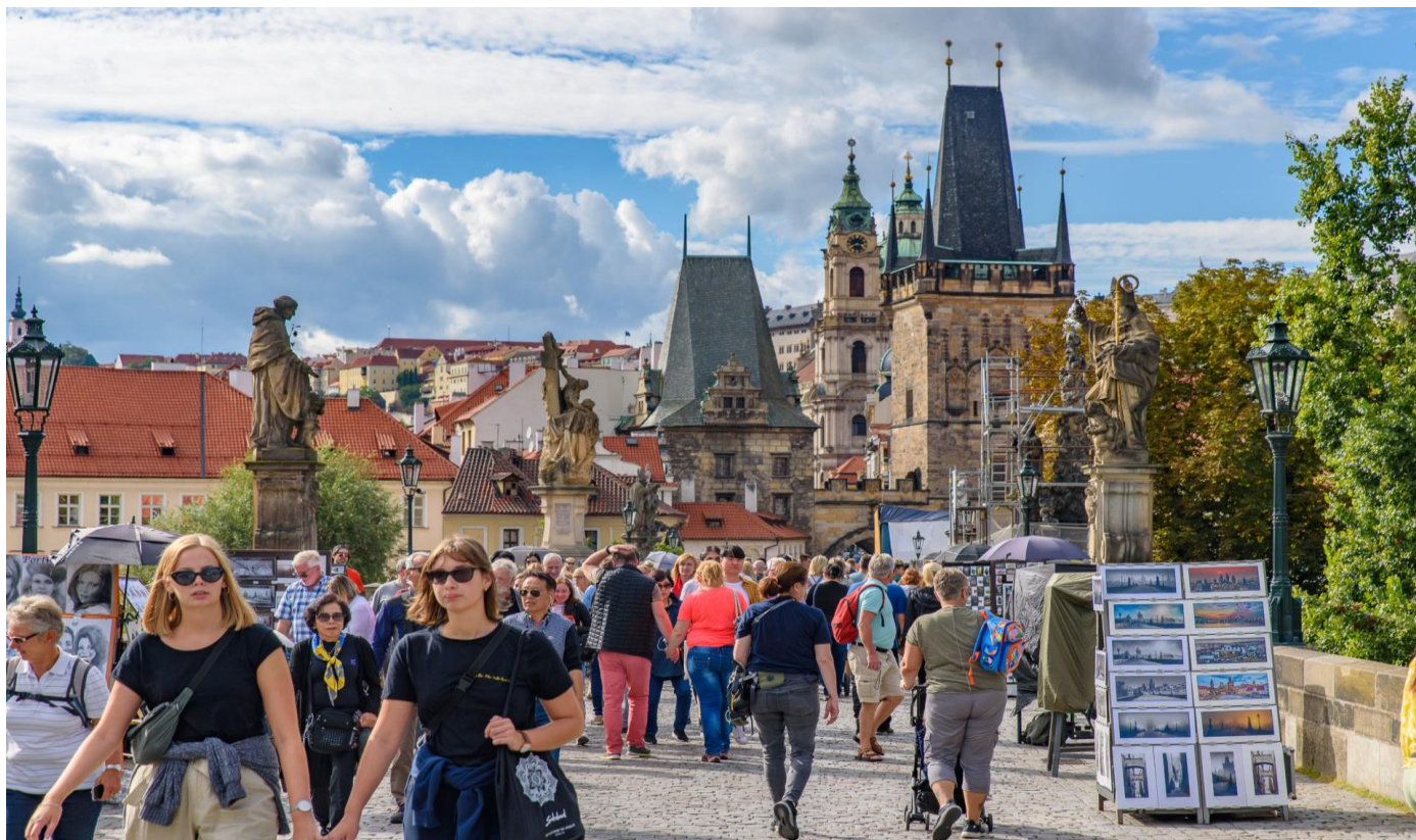
จากนั้นนำท่าน ล่องเรือแม่น้ำวัลตาวา ชมความสวยงามของ 2 ฝั่งกรุงปราก