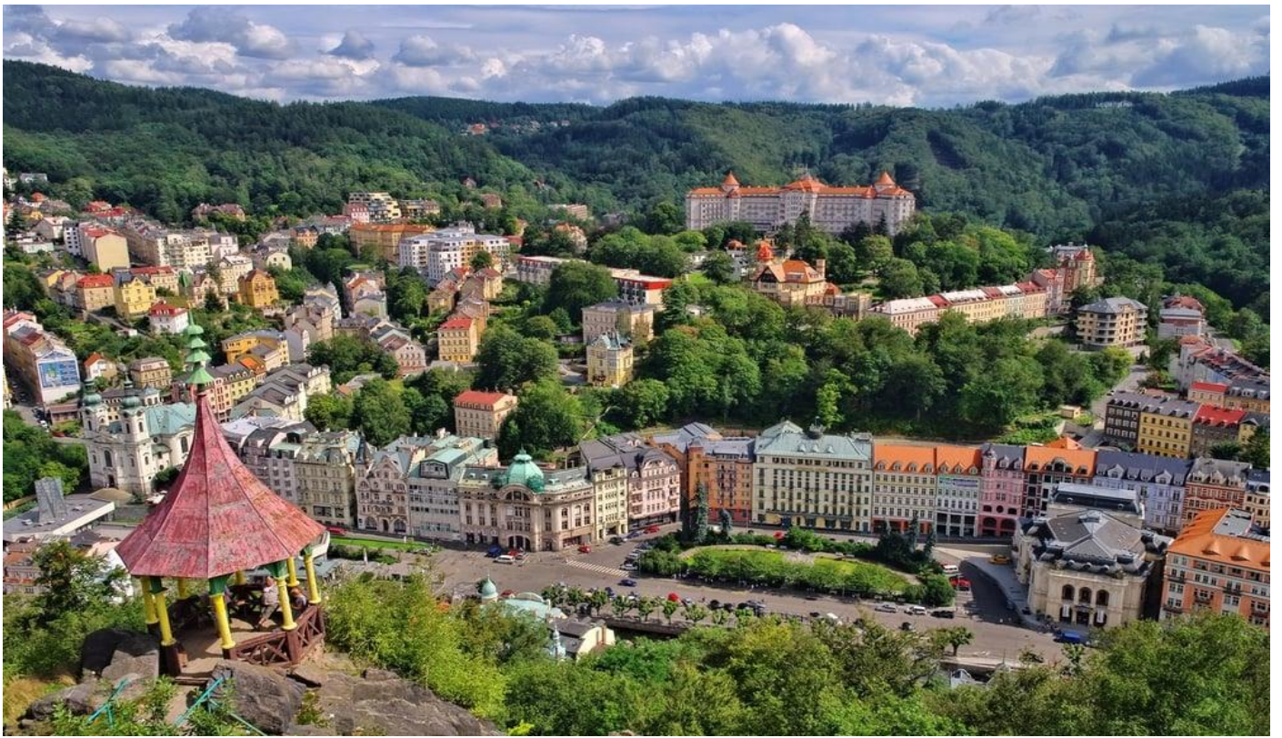
นำท่านเที่ยวชมเมืองคาร์โลวี วารี เมืองสวยอันดับต้นๆของชาวโบฮีเมีย เมืองตั้งอยู่ในหุบเขาโดยมีแม่น้ำเทปปาไหลผ่านเมือง บ้านเรือนสไตล์นีโอเรอเนสซองส์ของคีร์สตันสไตสวายงาม