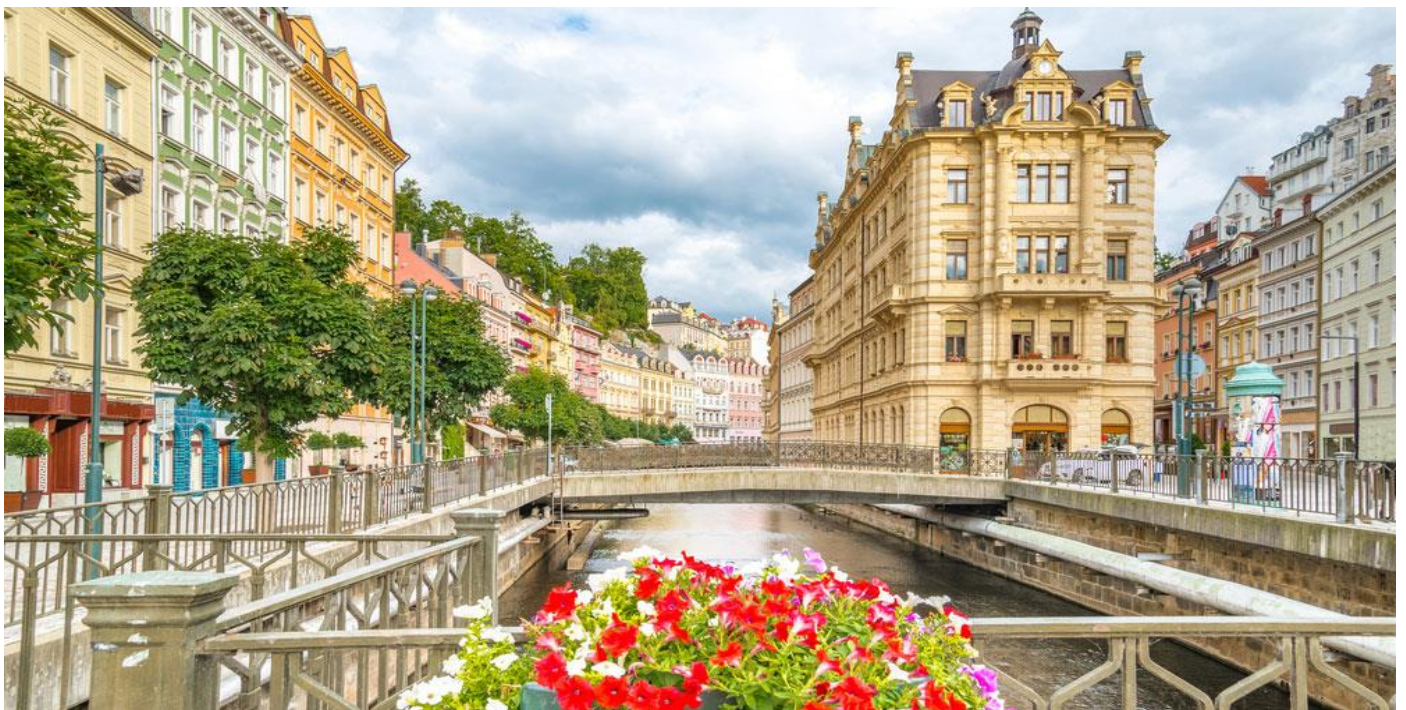
นำท่านเดินชมเมืองเลือกซื้อสินค้าพื้นเมือง ชิมน้ำแร่ฟรี