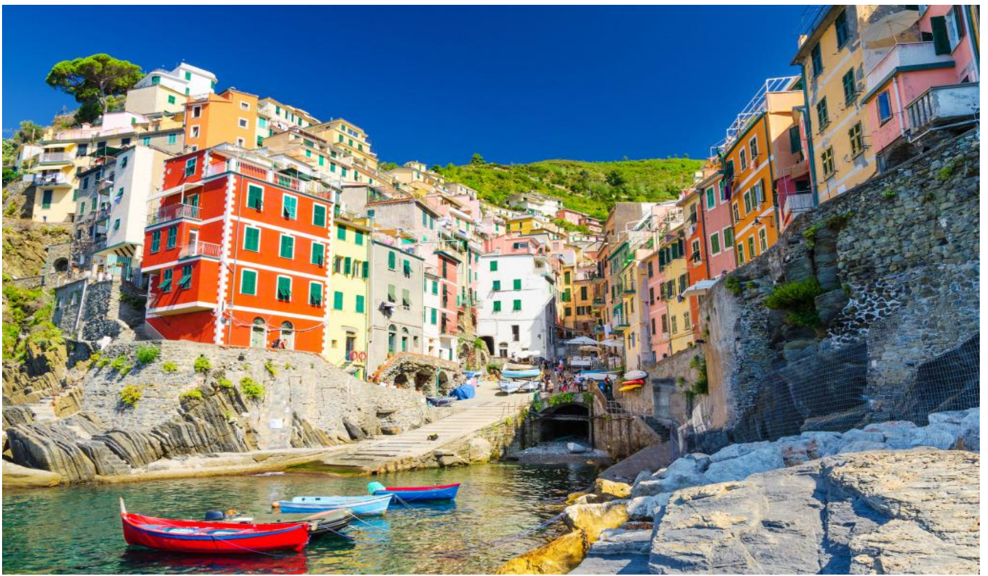
กลางวัน รับประทานอาหารกลางวัน ณ ภัตตาคารอาหารพื้นเมือง หมู่บ้าน VERNAZZA