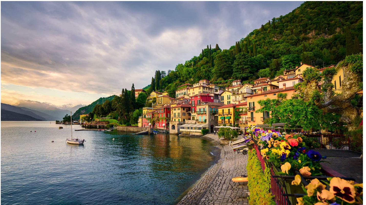
อิสระให้ท่านเดินเล่นชมเมืองวาเรนาตามอัชฌาศัย

จากนั้นนำท่านเดินทางสู่ เมืองวาเรนา (Varenna) เป็นจุดหมายปลายทางที่มีวิถีชีวิตแบบเรียบง่าย ผู้ที่มาเที่ยวพักผ่อนที่นี่มาเพื่อผ่อนคลายริมทะเลสาบ เป็นเมืองเก่าพันปี เป็นหมู่บ้านชาวประมงโบราณ เมืองนี้นักท่องเที่ยวชอบมากันเป็นเมืองที่สวยงามที่สุดในทะเลสาบโคโม บ้านเรือนเรียงรายสีฉูดฉาด เป็นย่านที่มีร้านอาหาร ร้านช้อปปิ้ง และคนมักนิยมมาดูพระอาทิตย์ตกกันที่นี่ เมืองวาเรนา ได้รับการขนานนามว่าเป็นทางเดินแห่งรัก เพราะทุกทางที่เดินสุดโรแมนติกทุกมุม