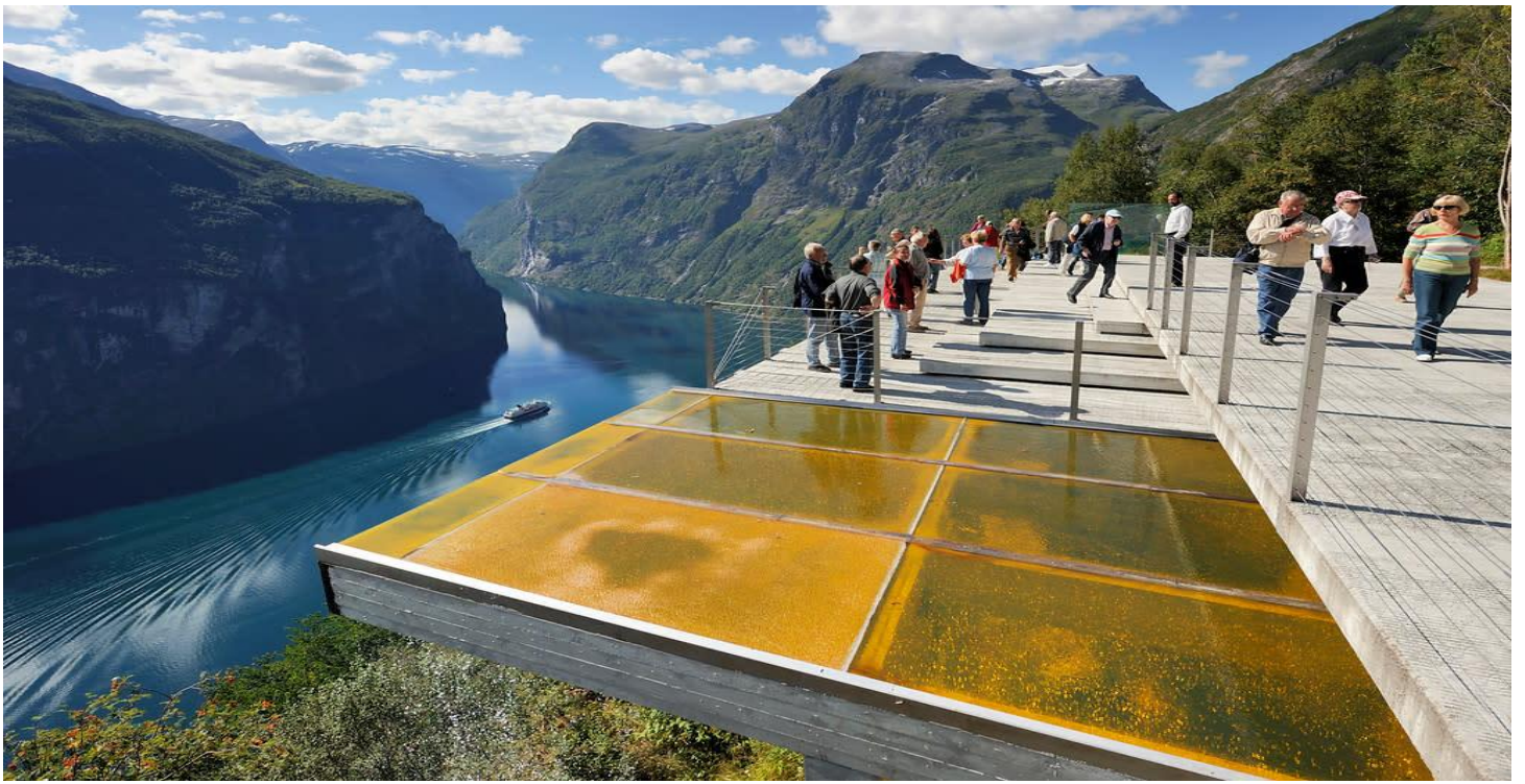
อิสระให้ท่านได้เก็บภาพความประทับใจตามอัธยาศัย