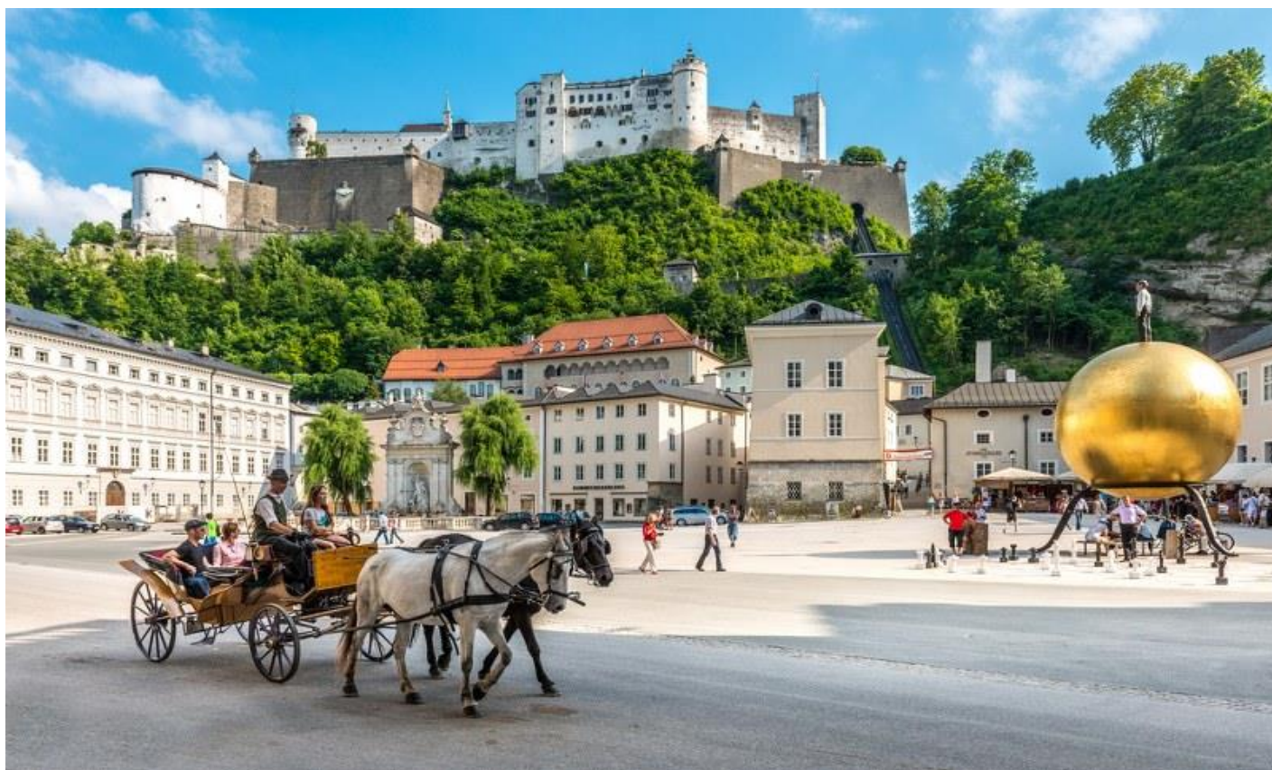
จากนั้นนำท่านข้ามแม่น้ำซาลส์ซัค ที่ไหลผ่านกลางตัวเมือง