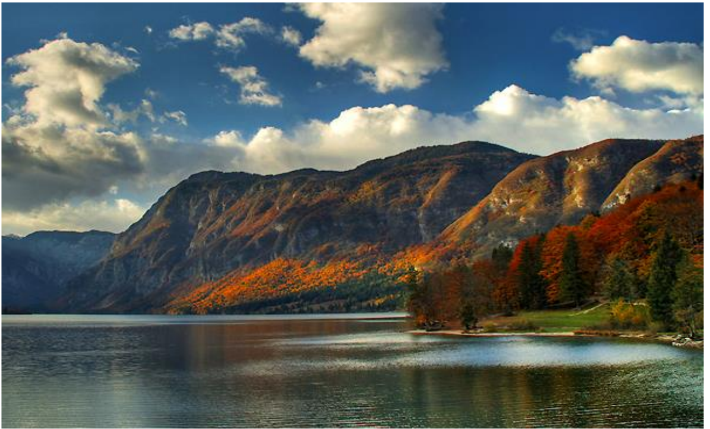
นำท่าน ชื่นชมความงามของทะเลสาบโบอินจ์