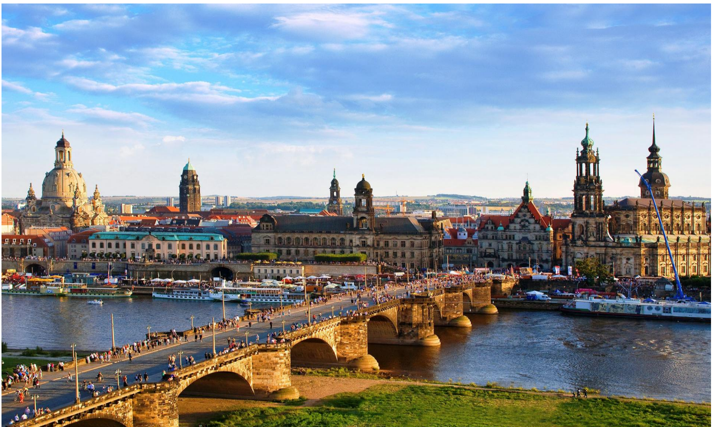
นำท่านชม กำแพงกระเบื้องเคลือบไมเซ่น PROCESSION OF DUKES ประดับด้วยกระเบื้องเคลือบไมเซ่น ถึง 25,000 แผ่น ความยาว 102 เมตร ที่รอดพ้นจากการถูก โจมตีทางอากาศเมื่อคราวสงครามโลกครั้งที่สองได้อย่างเหลือเชื่อ จากนั้นนำท่านบันทึกภาพโบสถ์แห่งเดรสเดน DRESDEN FRAUENKIRCHE ที่ได้รับการบูรณะขึ้นมาใหม่เกือบ 100% ตั้งแต่ปี 1994 และเพิ่งเสร็จสมบูรณ์ลงเมื่อปี 2006 เพื่อเป็นการฉลองครบรอบ 800 ปีของเมืองเดรสเดน จากนั้นมีเวลาให้