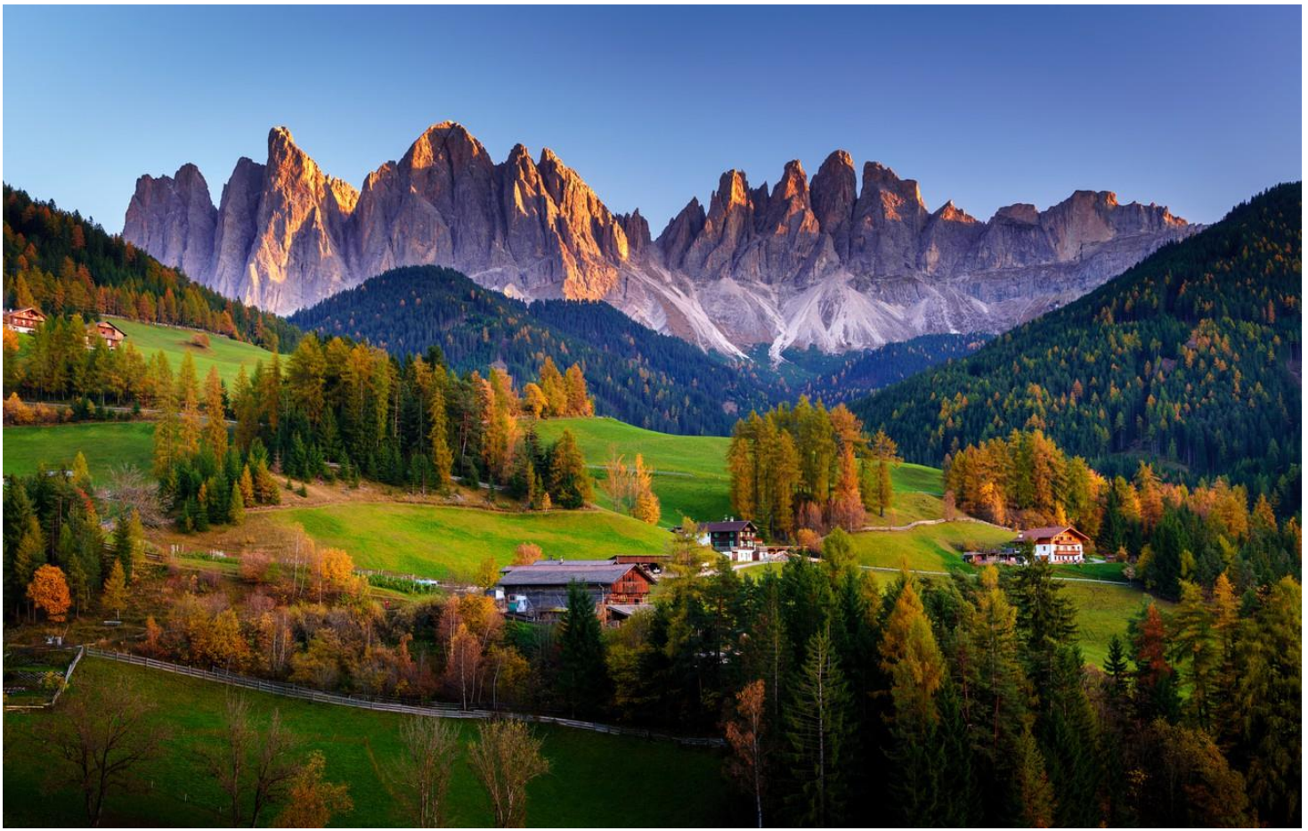
อิสระให้ท่านเก็บภาพตามอัธยาศัย จนได้เวลานำท่านเดินทางกลับ