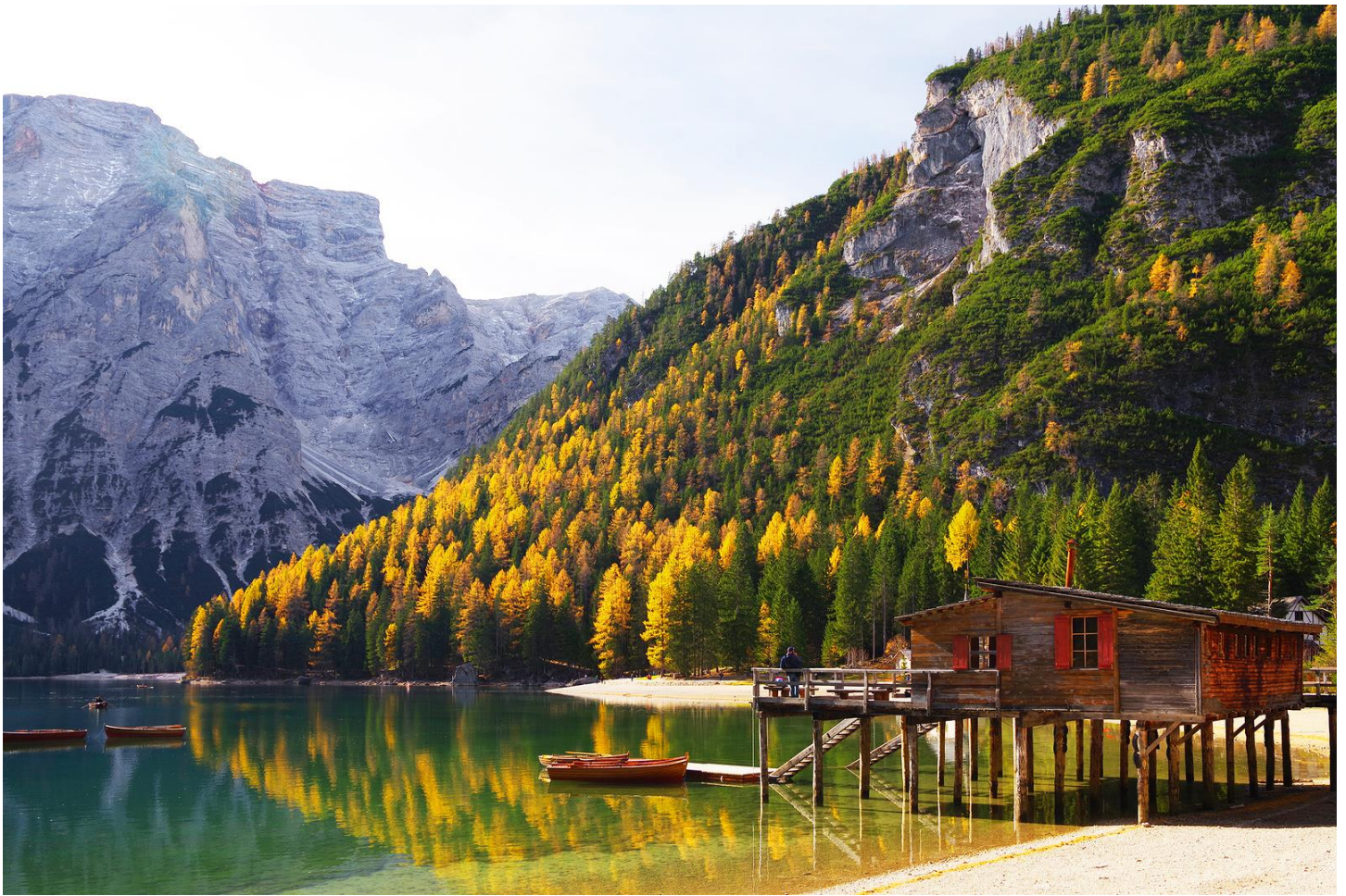
ให้ท่านอิสระถ่ายรูปตามอัธยาศัย