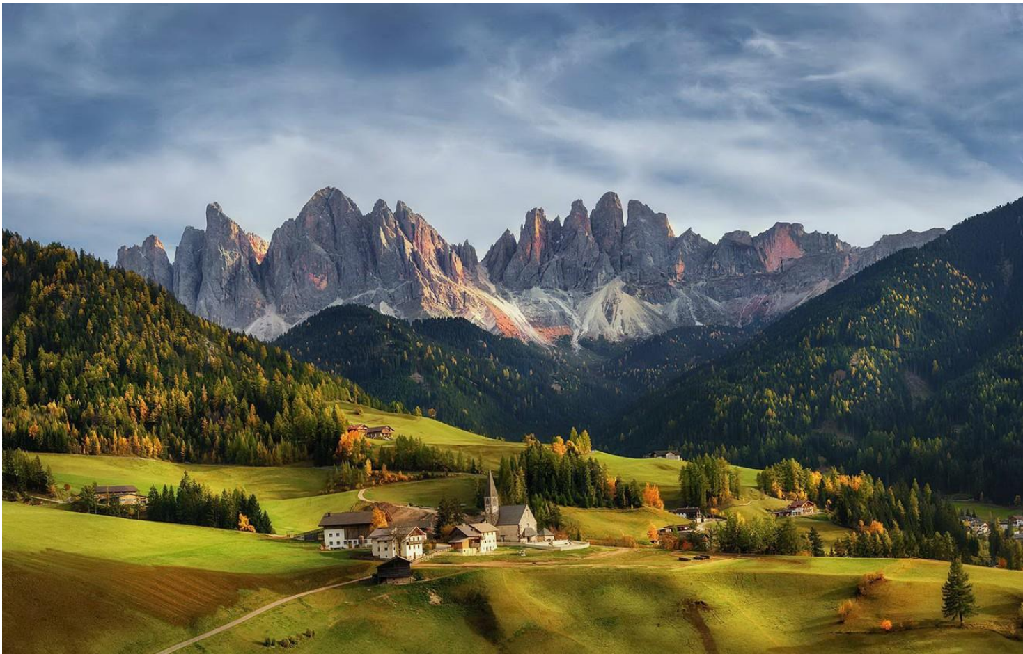
นำท่านถ่ายรูปกับ โบสถ์ St.Johann โบสถ์เล็กๆ ส้อมรอบไปด้วยต้นสนและ ยอดเขาแหลมของเทือกเขาโดโลไมต์ ซึ่งถือเป็นอีกหนึ่งสถานที่ในโดโลไมต์ที่ถูกถ่ายภาพเป็นอันดับต้นๆ เลยทีเดียว