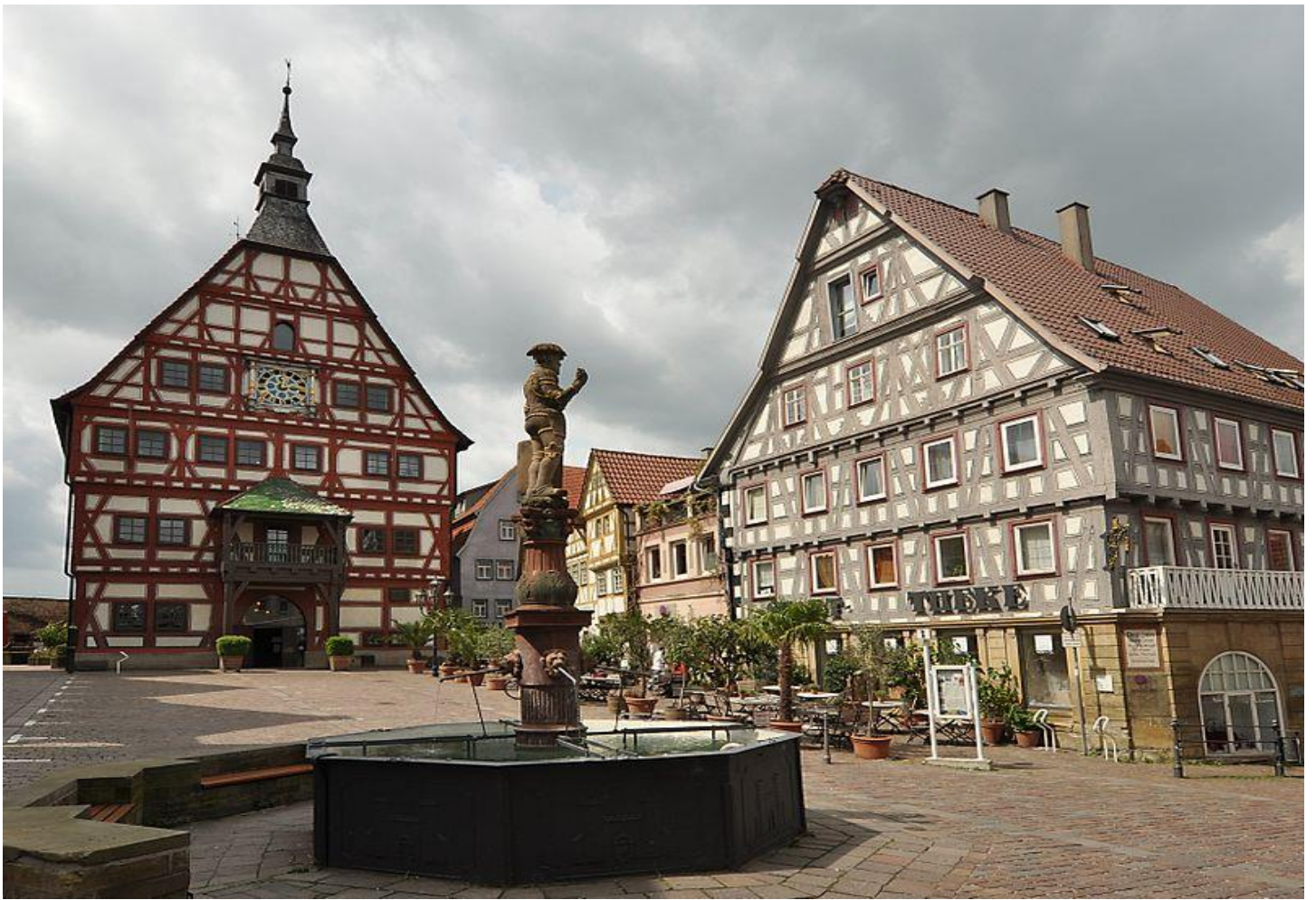
อิสระท่านเดินเล่นชมเมืองตามอัธยาศัย