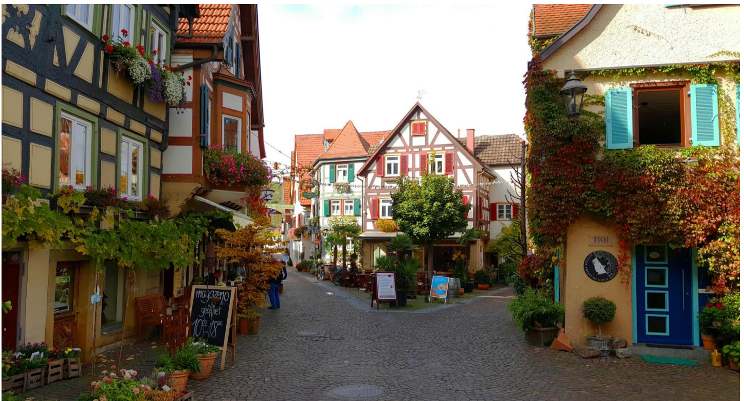
จากนั้นนำท่านเดินทางสู่เมืองบาด วมเฟิน (Bad Wimpfen) (ระยะทาง 45 กิโลเมตร ใช้เวลา 40 นาที) ตั้งอยู่ริมฝั่งตะวันตกของแม่น้ำเนคคาร์ ( River Neckar) ปัจจุบันเมืองบาด วมเฟินได้กลายเป็น ศูนย์รวมของสถาบันสปาต่างๆ รวมไปถึงเหล่าอาคารบ้านเรือนที่มีความโดดเด่นทางด้าน