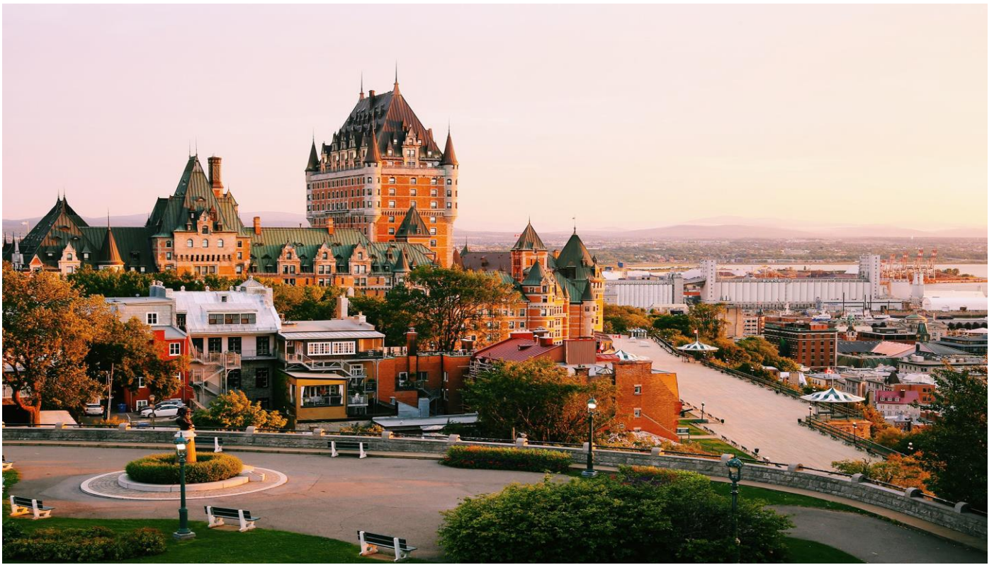
นำท่านเดินเล่นชมเมือง ณ Dufferin Terrace ทางเดินริมแม่น้ำ