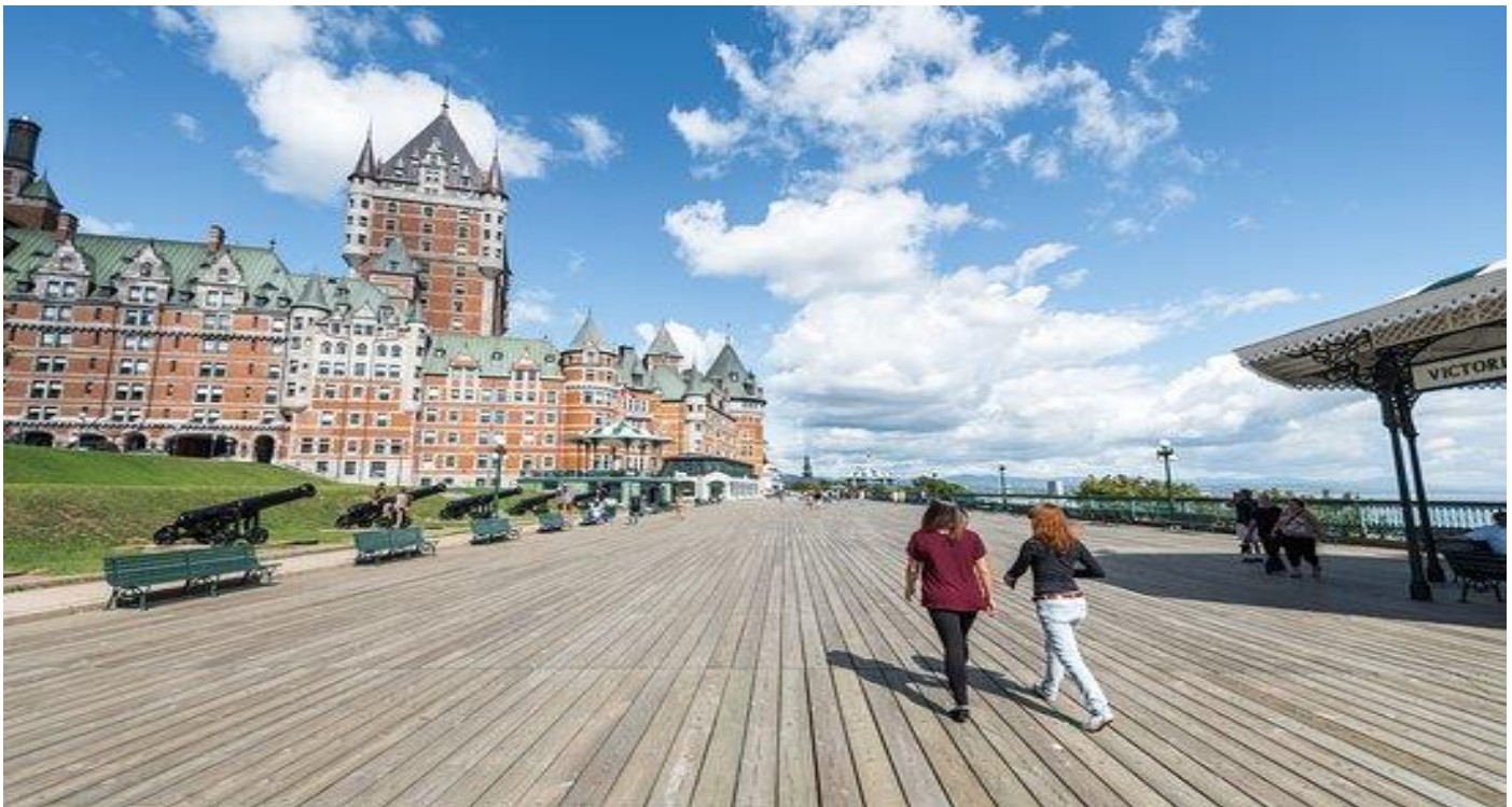
นำท่านเข้าชมโบสถ์นอร์เทรอดาม เด วิคตัวร์ (Church Notre-Dame-des-Victoires) เป็นโบสถ์ที่เก่าแก่ที่สุดแห่งหนึ่ง ชมความงามของงานศิลป์ และแท่นบูชาที่มีลักษณะคล้ายป้อมปราการอีกทั้งใกล้ๆ กันยังเป็นที่ตั้งของพิพิธภัณฑ์จัดแสดงศิลปวัตถุโบราณอายุกว่า 5,000 ปี และอื่นๆ