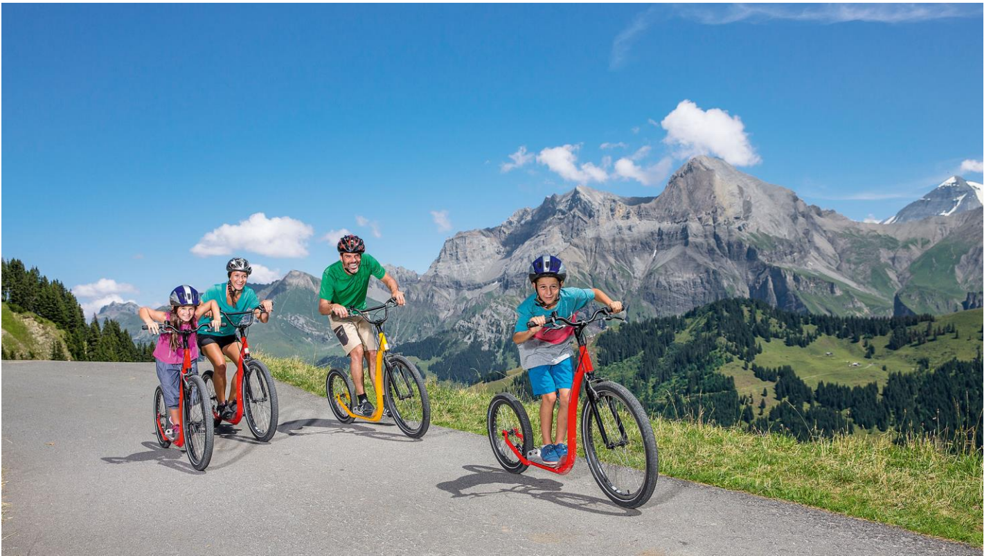
จากนั้นอิสระให้ท่านเดินเล่นชมเมืองกรินเดลวาลด์ตามอัชยาศัย