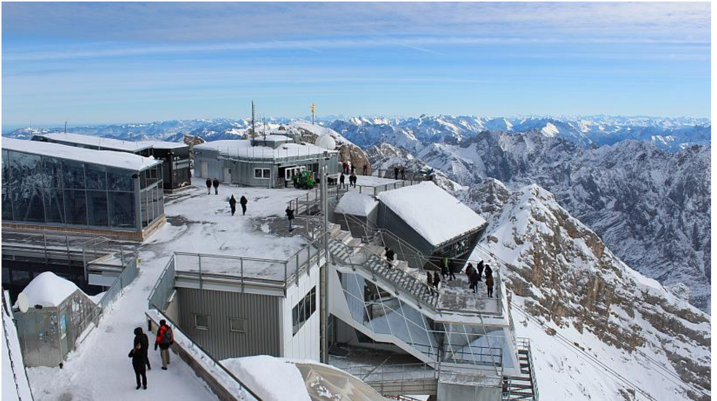
อิสระทุกท่านถ่ายรูปตามอัธยาศัย

f : Happylongway Travel ID : @happylongway