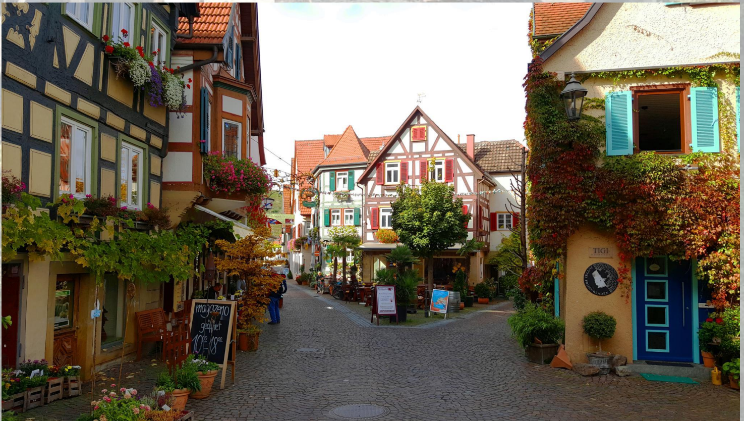
จากนั้นนำท่านเดินทางสู่เมืองบาด วิกเฟิน (Bad Wimpfen) ตั้งอยู่ริมฝั่งตะวันตกของแม่น้ำเนคคาร์ (River Neckar) ปัจจุบันเมืองบาด วิกเฟินได้กลายเป็นศูนย์รวมของสถาบันสปาต่างๆ รวมไปถึง