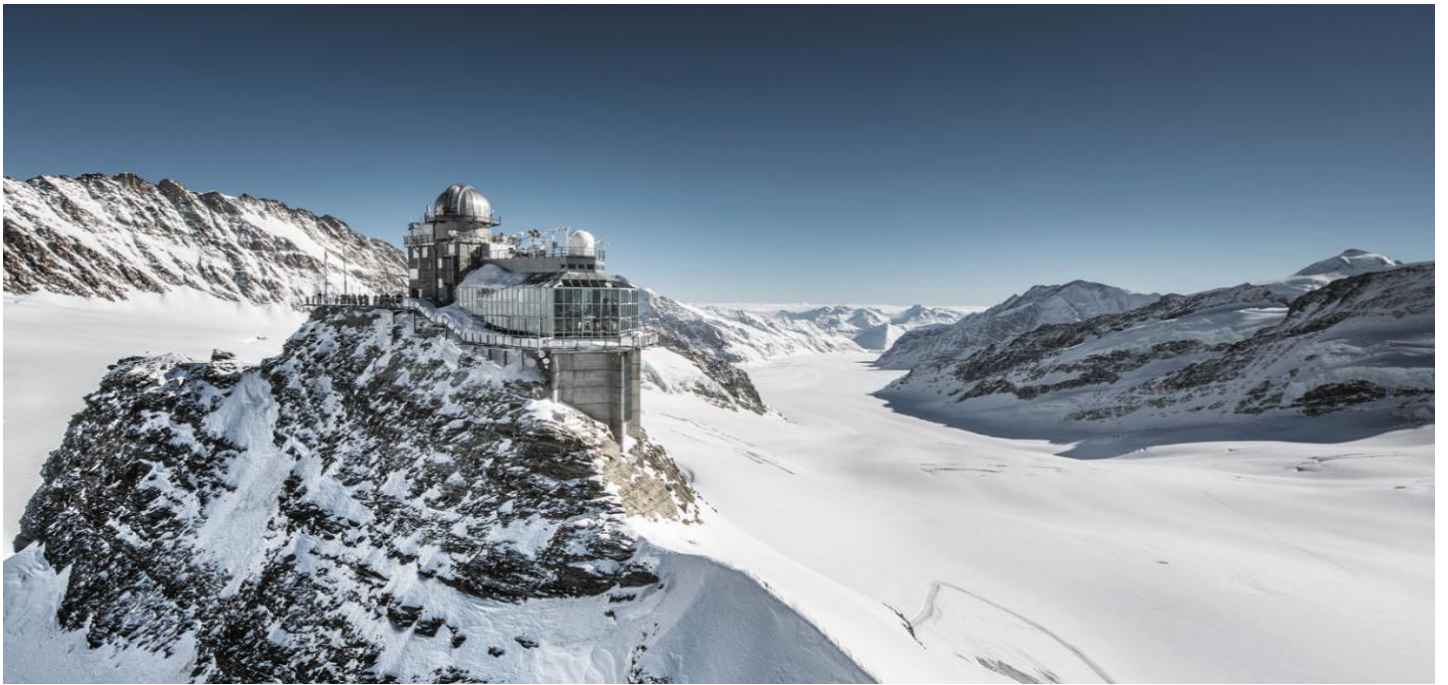
อิสระให้ท่านได้ออกมาสัมผัสหิมะ ณ ด้านนอกของยอดเขา ซึ่งจะมีหิมะปกคลุมตลอดทั้งปี