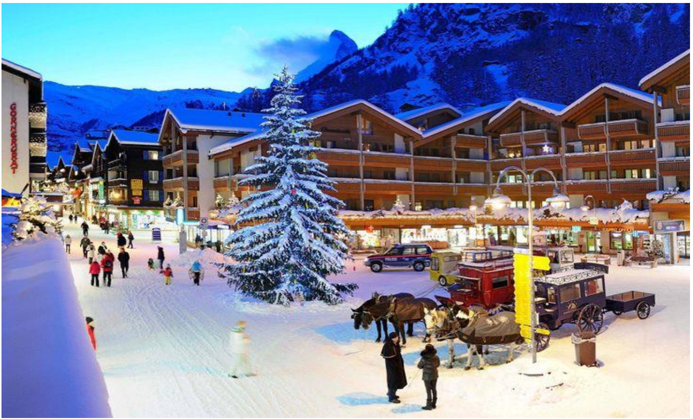
อิสระให้ท่านได้เลือกซื้อสินค้าของฝากตามอัธยาศัย