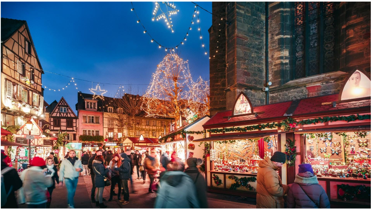
อิสระให้ทุกท่านเดินชมเมืองตามอัธยาศัย