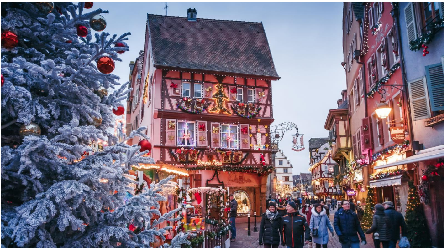
อิสระให้ท่านเดินชมตลาดคริสมาสต์ ตามอัชยาศัย