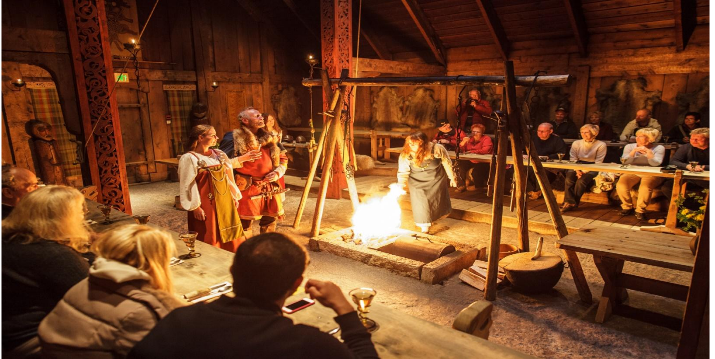
กลางวัน รับประทานอาหารกลางวัน ณ ภัตตาคารอาหารพื้นเมือง

ใช้โครงเรือไวคิงโบราณและภายในได้จัดแสดงข้าวของเครื่องใช้และ/หรือเรื่องราวเกี่ยวกับวิถีชีวิตของชาวไวคิง ให้ ท่านชมพิพิธภัณฑ์ไวคิง และพายเรือไวคิงโบราณ ซึ่งเป็นอีกกิจกรรมหนึ่งที่พลาดไม่ได้ เมื่อไปเยือนพิพิธภัณฑ์ไวคิงแห่งนี้