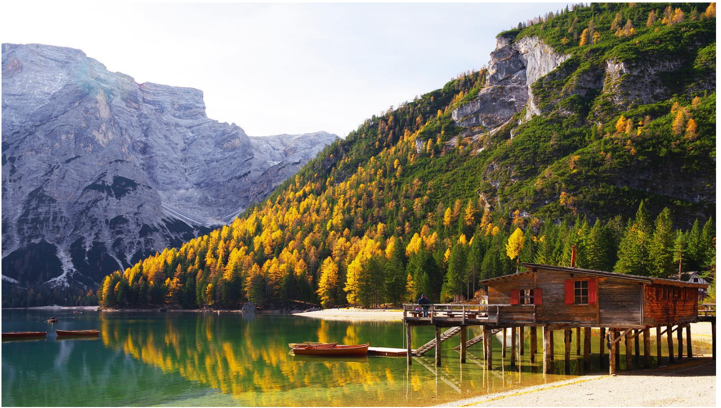
ให้ท่านอิสระถ่ายรูปตามอัธยาศัย