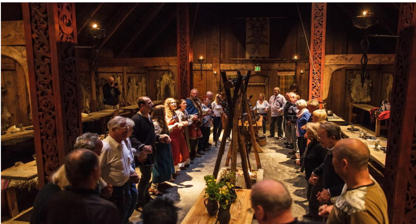
กลางวัน รับประทานอาหารกลางวัน ณ ภัตตาคารอาหารจีน

นำท่านเดินทางสู่ พิพิธภัณฑ์ไวกิง (LOFOTR VIKING MUSEUM) เนื่องจากบริเวณหมู่เกาะลอฟโฟเทน มีการค้นพบว่าเป็นที่ตั้งของชุมชนชาวไวกิงในอดีต บนเกาะจึงมีพิพิธภัณฑ์ไวกิงที่แสดงเรื่องราวและหลักฐานทางประวัติศาสตร์ของชาวไวกิงไว้มากมาย ซึ่งรูปแบบพิพิธภัณฑ์ถูกออกแบบโดยใช้โครงเรือไวกิงโบราณและภายในได้จัดแสดงข้าวของเครื่องใช้และเรื่องราวเกี่ยวกับวิถีชีวิตของชาวไวกิง ให้ท่านชมพิพิธภัณฑ์ไวกิง และพายเรือไวกิงโบราณ ซึ่งเป็นอีกกิจกรรมหนึ่งที่พลาดไม่ได้ เมื่อไปเยือนพิพิธภัณฑ์ไวกิงแห่งนี้