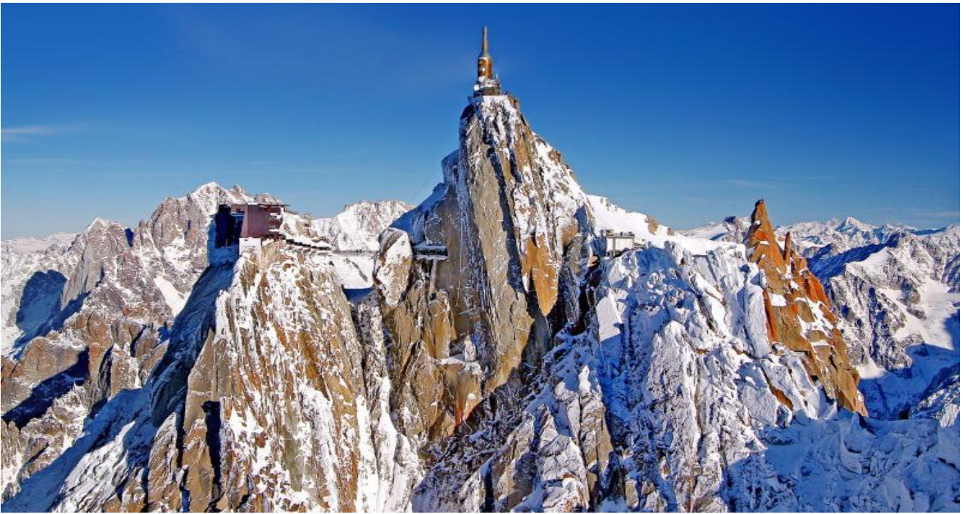
อิสระให้ท่านชมวิวหรือทำกิจกรรมต่างๆ ตามอัชฌาศัย