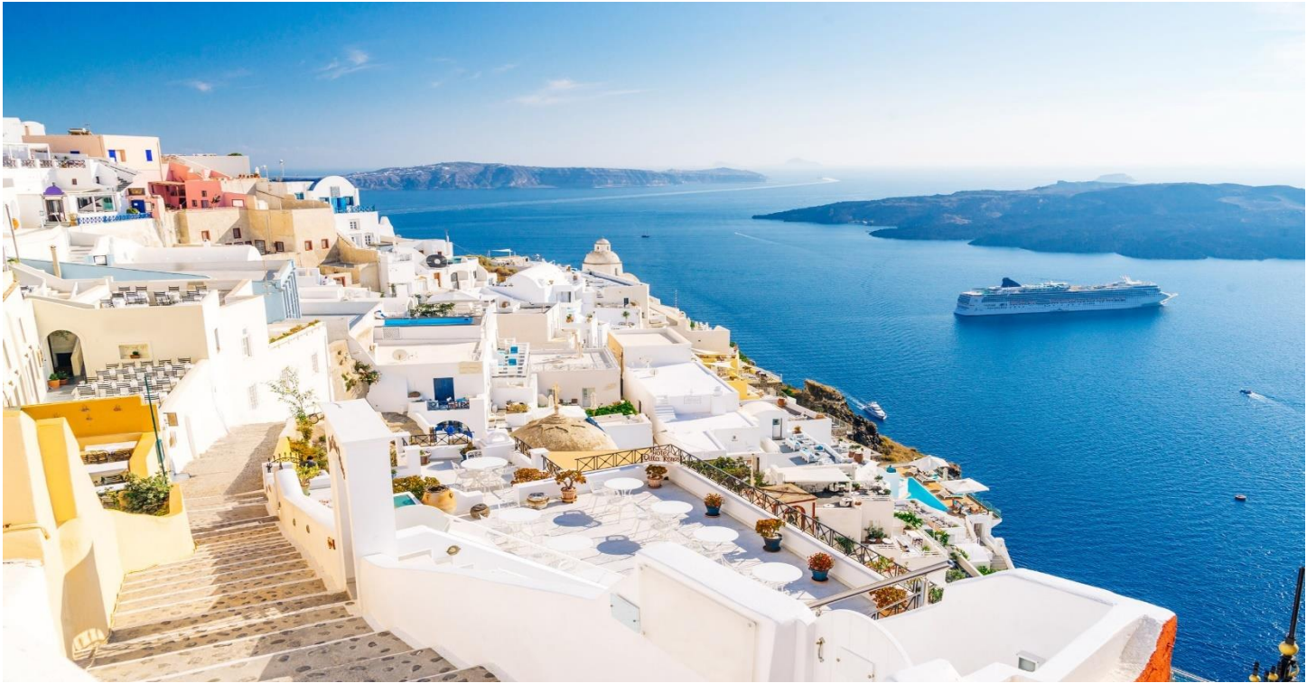
นำท่านเดินเล่นชมเมืองตามอัธยาศัย

จากนั้นนำท่านชม เมืองฟีร่า (Fira) เมืองหลวงของซานโตรินี่ ซึ่งออกเสียงได้อีกอย่างว่า ธีรา (Thira) ตั้งอยู่บนริมหน้าผา caldera สูงจากระดับน้ำทะเลประมาณ 260 เมตรถือเป็นแหล่งช้อปปิ้ง มีร้านค้า ร้านขายของที่ระลึก ร้านอาหาร บาร์ ไนต์คลับ ฯลฯ