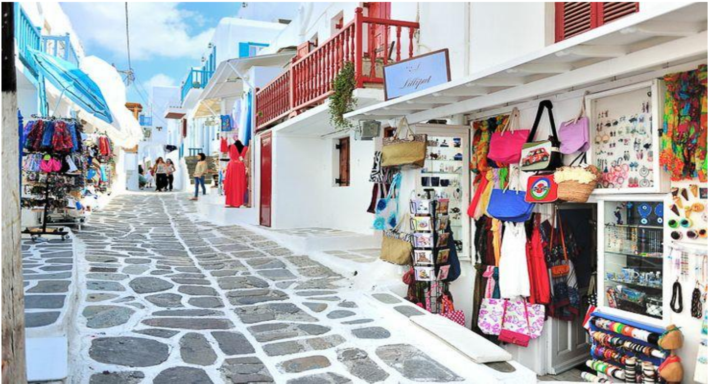
อิสระให้ท่านเดินเล่นชมเมืองตามอัธยาศัย

กลุ่มเรือหลากสีสัน อันเป็นภาพพื้นเมืองที่หาชมได้ยาก ที่มีความโดดเด่น และงดงาม อีกทั้งยังได้รับการยอมรับว่าเป็นหนึ่งในสถานที่สวย และ โรแมนติกที่สุดบนเกาะ มิโคนอสอีกด้วย จนได้เวลาอันสมควร