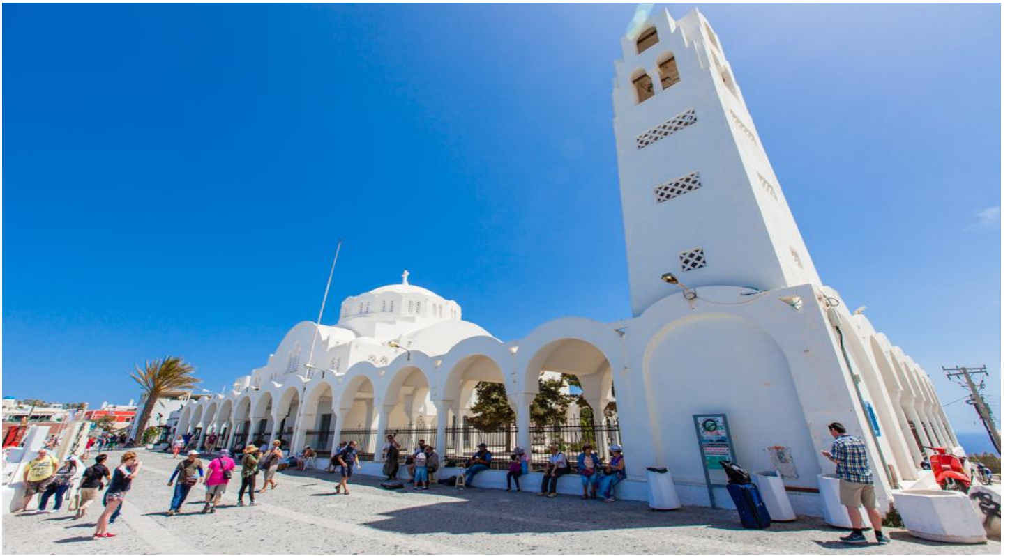
ให้ท่านเดินเล่นเลือกซื้อสินค้าตามอัชยาศัย