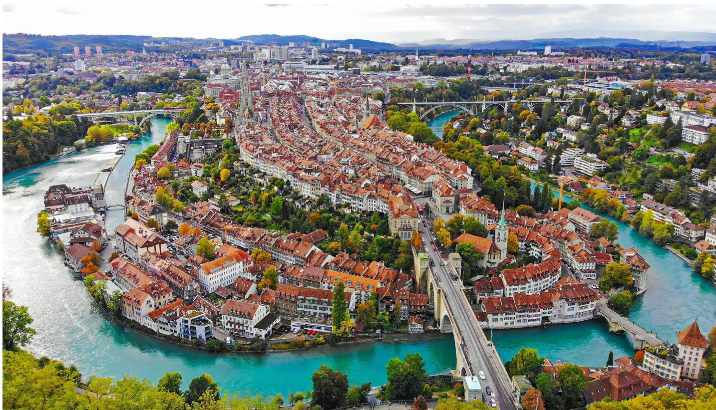
นำท่านเดินชมตัวเมืองเบิร์น

07.50 น. ถึงสนามบินซูริค ประเทศสวิตเซอร์แลนด์ หลังจากผ่านพิธีตรวจคนเข้าเมือง นำท่านเดินทางสู่ กรุงเบิร์น (BERN) (ระยะทาง 130 กิโลเมตร ใช้เวลา 1 ชม. 45 นาที) เมืองหลวงของประเทศ ชมตัวเมืองเก่าที่อาคารบ้านเรือนยังได้รับการดูแลรักษาไว้เป็นอย่างดีเหมือนเมื่อหลายร้อยปีก่อนจนองค์การ ยูเนสโกประกาศให้เป็นมรดกโลกด้านวัฒนธรรม โดยกรุงเบิร์นตั้งอยู่ทางโค้งของริมแม่น้ำอาเรอ Aare River เป็นเมืองที่มีแม่น้ำล้อมรอบไว้ทั้ง 3 ด้าน เป็นชัยภูมิที่เหมาะสมในการป้องกันการรุกรานจากศัตรูได้เป็นอย่างดี ตัวเมืองเบิร์น เริ่มก่อสร้างเมื่อ ค.ศ. 1191 เมื่อยุคแบร์ชโทลด์ที่ 5 แห่งราชวงศ์แซริงเงิน เข้ามามีอำนาจในการปกครองเมือง มีการสร้างปราสาทขึ้นบริเวณปลายแหลมริมฝั่งแม่น้ำ ชื่อว่า “เบิร์น” มาจากคำว่าแบร์ ซึ่งแปลว่า หมี เป็นสัตว์ในยุคแบร์ชโทลด์นำมาตั้งชื่อเมือง เป็นการที่ทรงดำริว่าจะตั้งชื่อเมืองตามสัตว์ที่เจอเป็นตัวแรก หมีจึงกลายมาเป็นสัญลักษณ์ของเมืองมาจนถึงทุกวันนี้