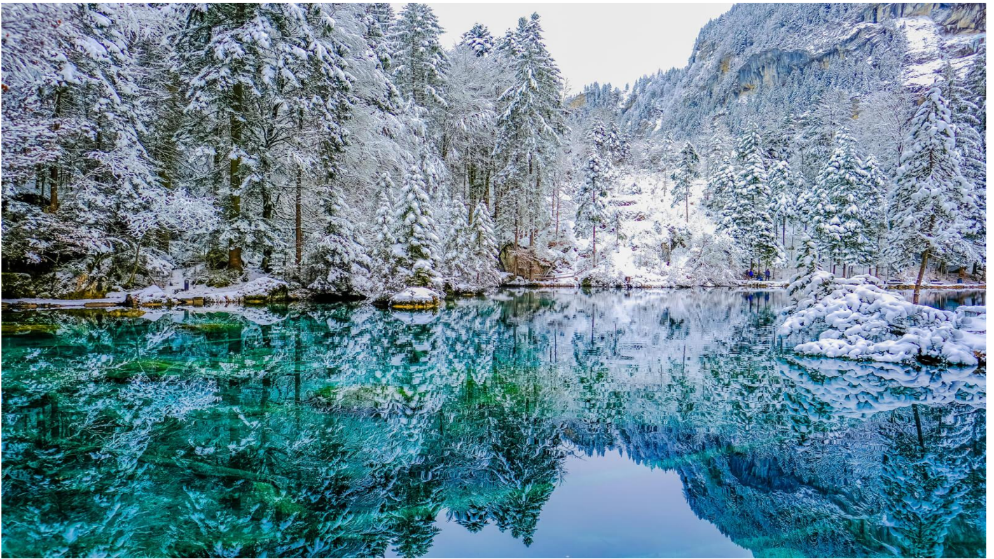
อิสระให้ท่านเดินเล่นถ่ายรูปกับทะเลสาบที่มีความสวยงามแห่งนี้