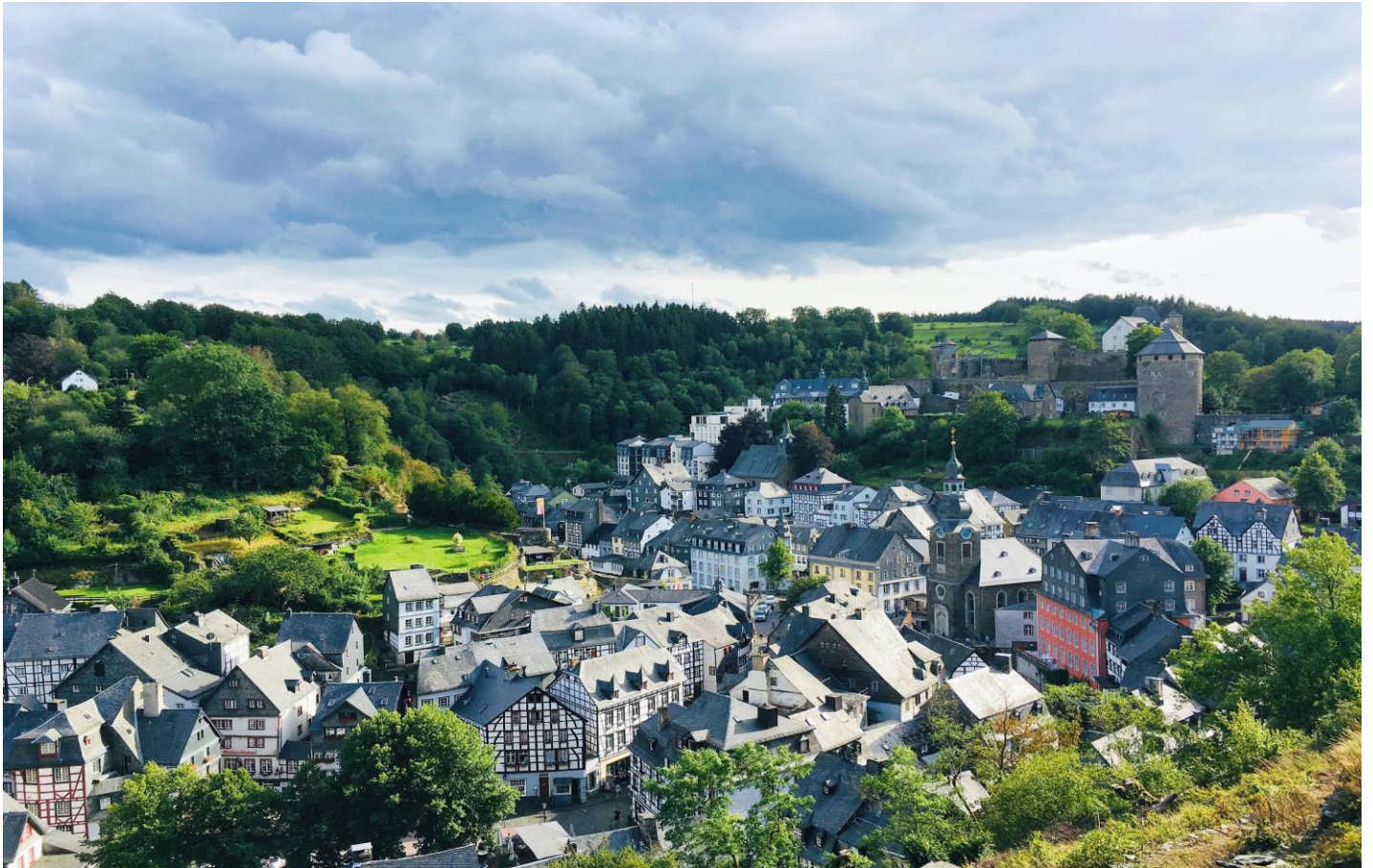
นำท่านเดินชมเมือง เลือกซื้อของฝากตามอัธยาศัย