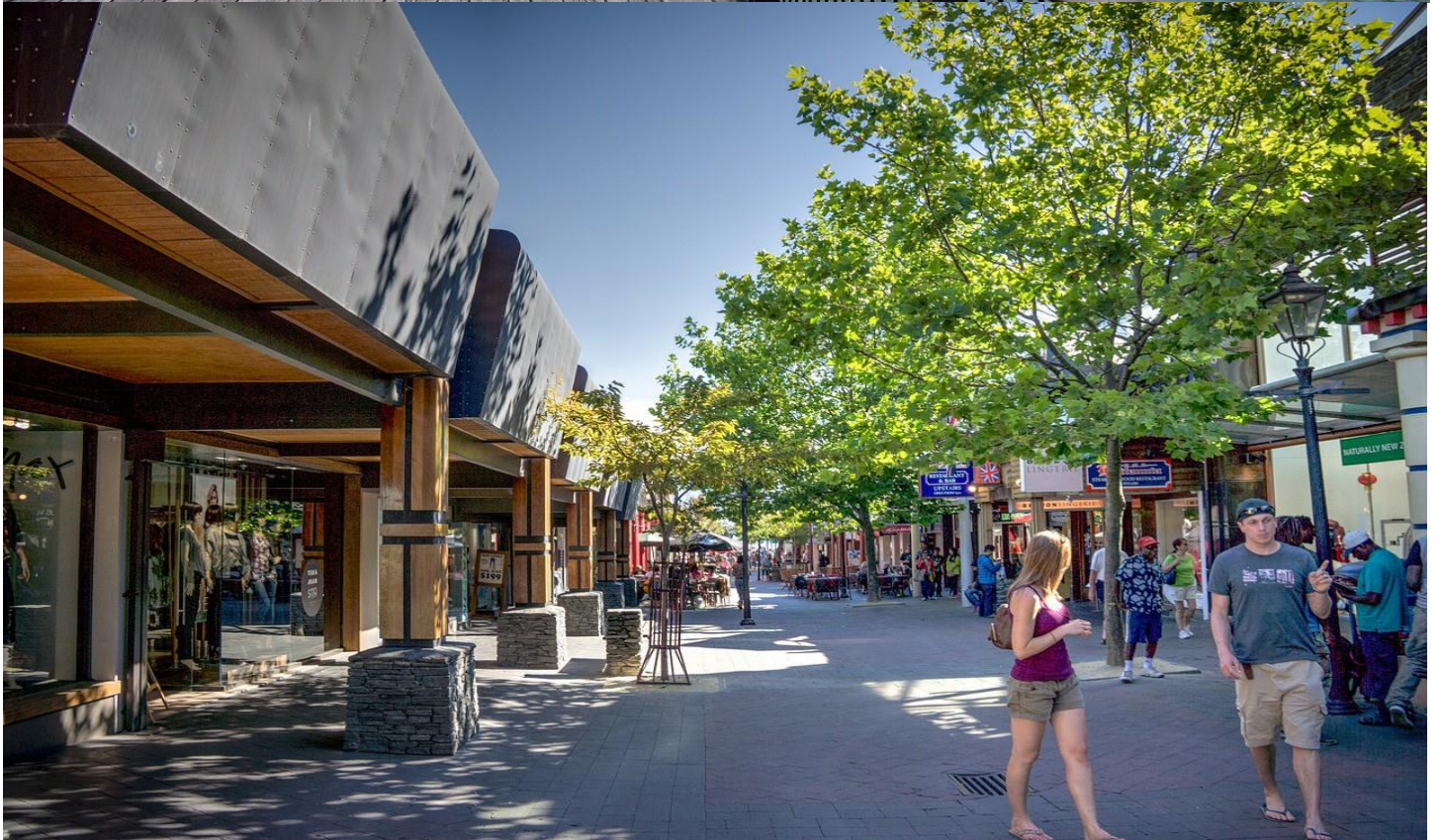
ช่วงบ่ายอิสระให้ท่านเดินพักผ่อนตามอัยาศัย หรือท่านไหนสนใจลองชิมแฮมเบอร์เกอร์ ร้านดัง Fergburger เบอร์เกอร์ที่มีชื่อเสียงไปทั่วโลก