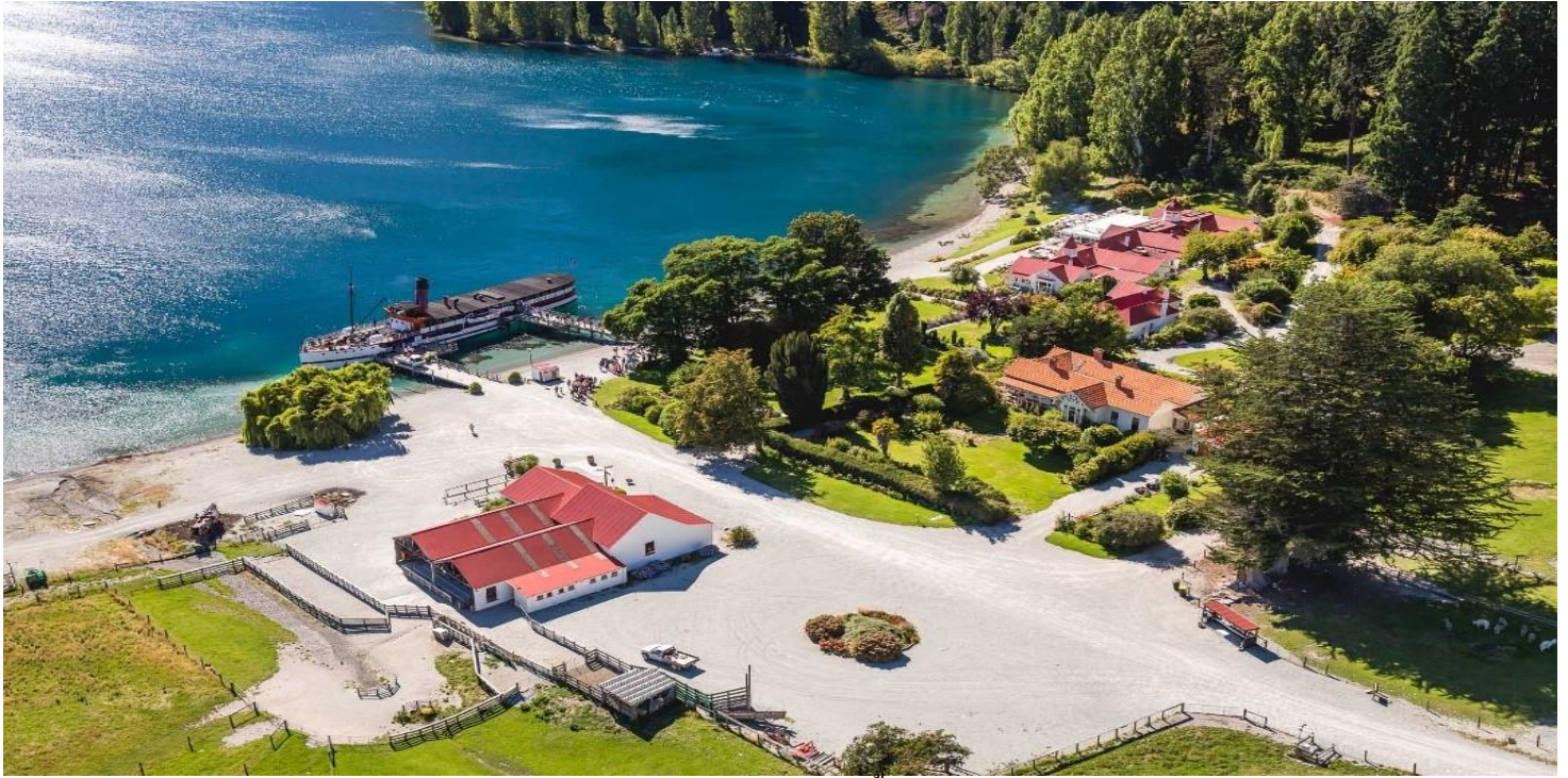
ท่านสามารถให้อาหารสัตว์ดูการทำงานของสุนัขเลี้ยงแกะ