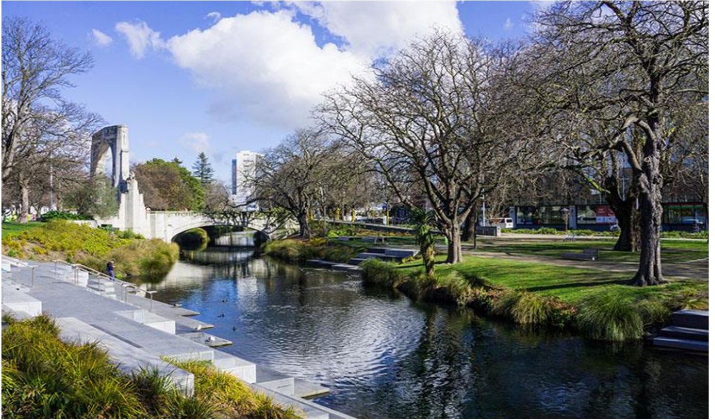
อิสระให้ท่านเล่นชมเมืองตามอัธยาศัย