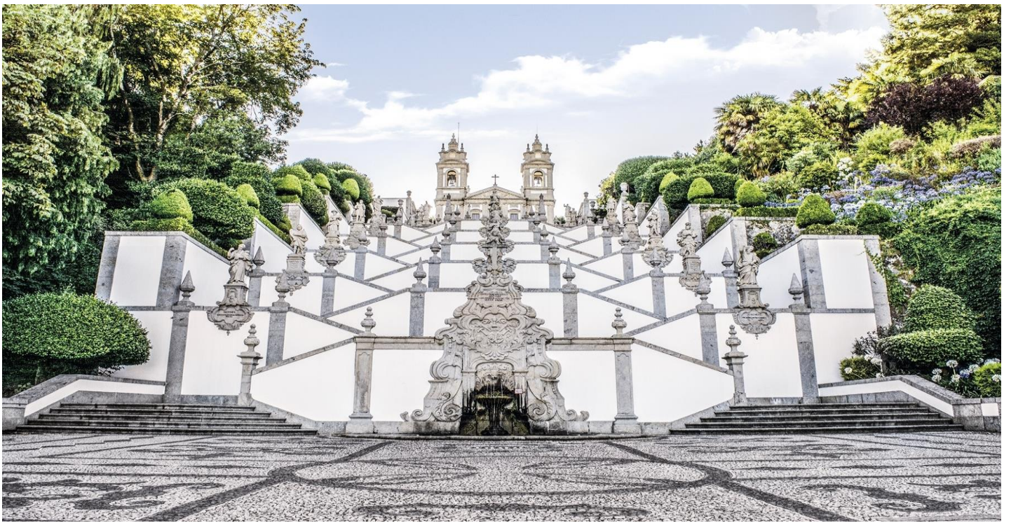
จากนั้นได้เวลานำท่านเข้าสู่เมืองเก่าของบรากา นำท่านเดินชมเมืองบรากาอันเก่าแก่