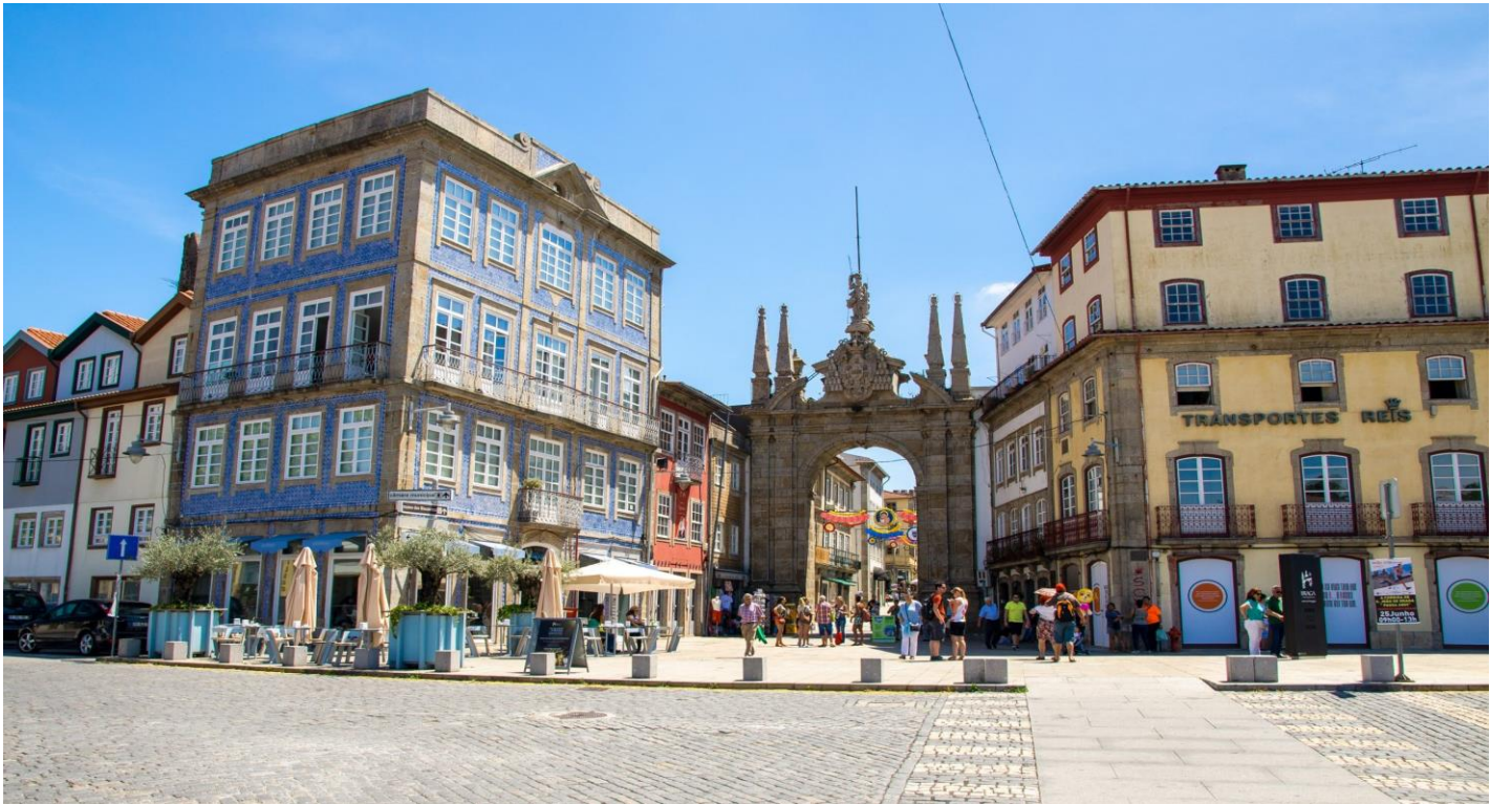
อิสระให้ท่านเดินเล่นชมเมืองตามอัธยาศัย