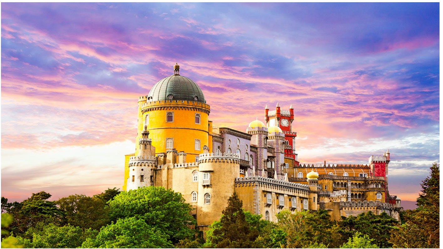
อิสระให้ท่านเดินเล่นชมเมืองตามอัชยาศัย