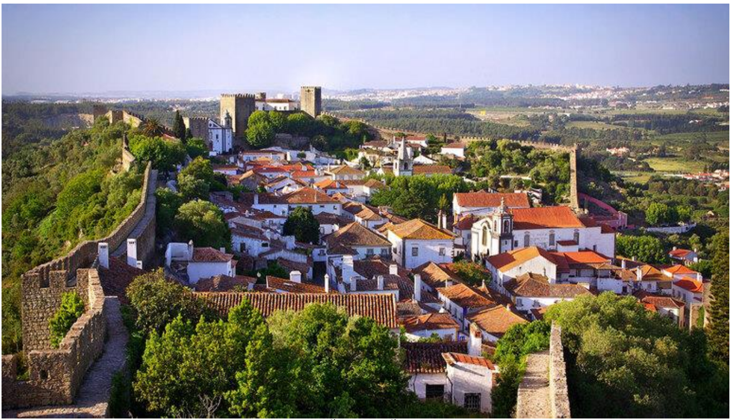
นำท่านเดินชมเมืองอิสระท่านเลือกซื้อสินค้าพื้นเมืองตามอัชฌาศัย