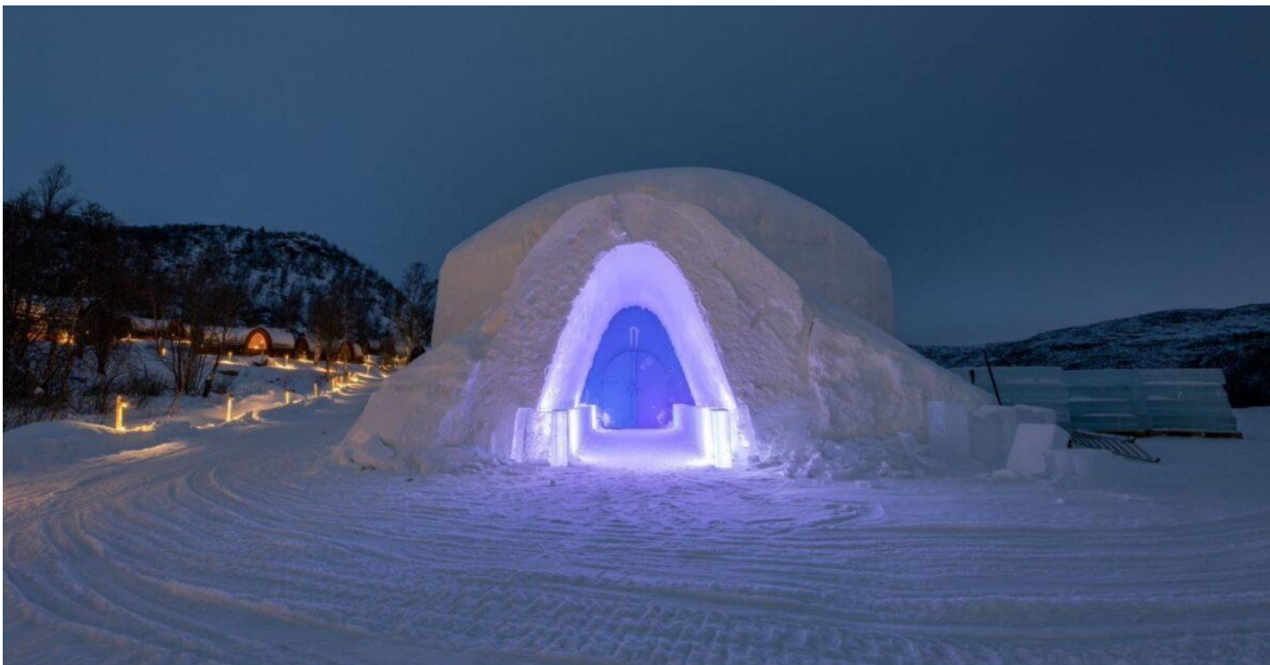
อิสระให้ท่านชมโรงแรมหิมะตามอัธยาศัย