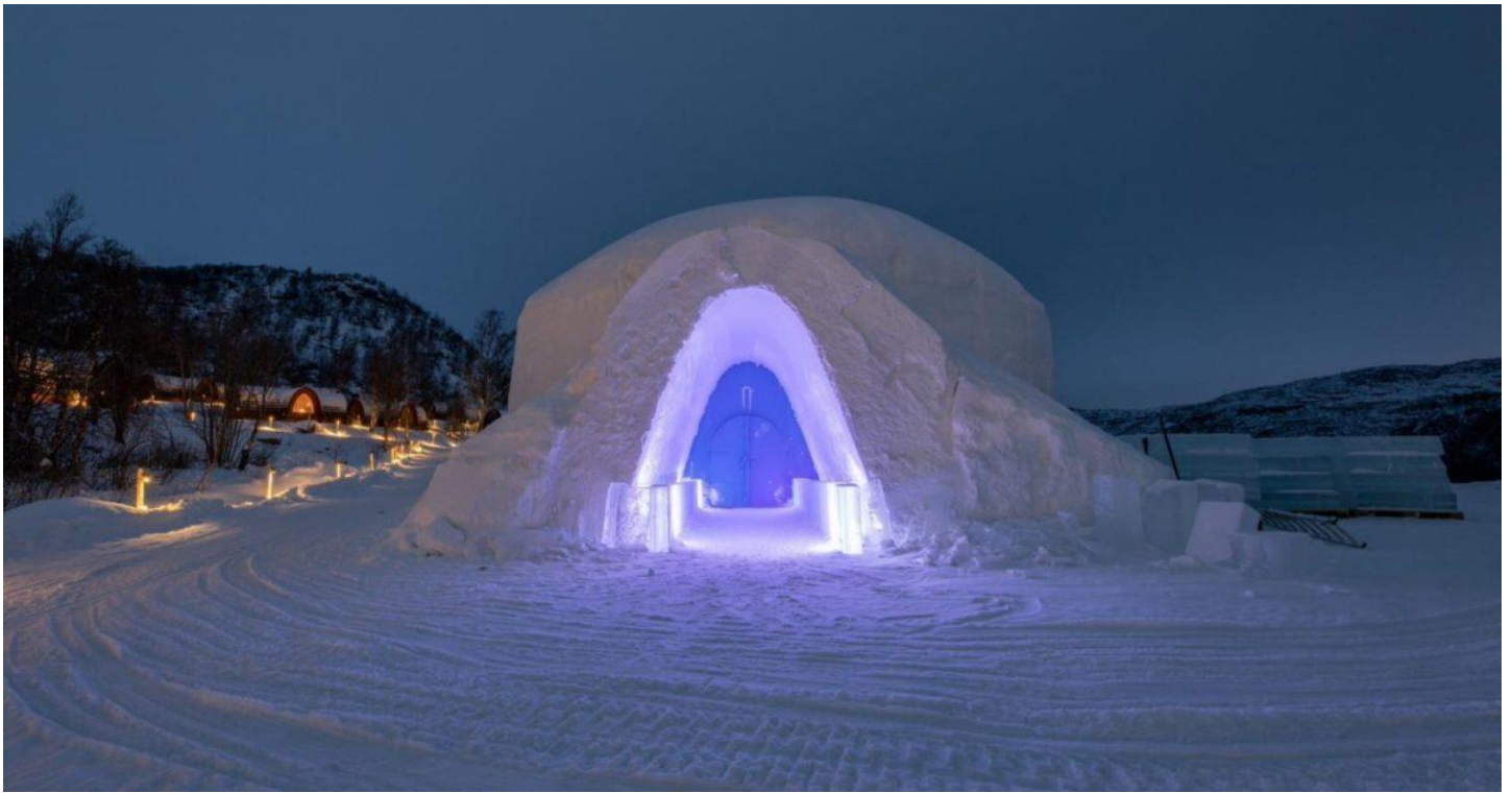
อิสระให้ท่านชม โรงแรมหิมะตามอัธยาศัย