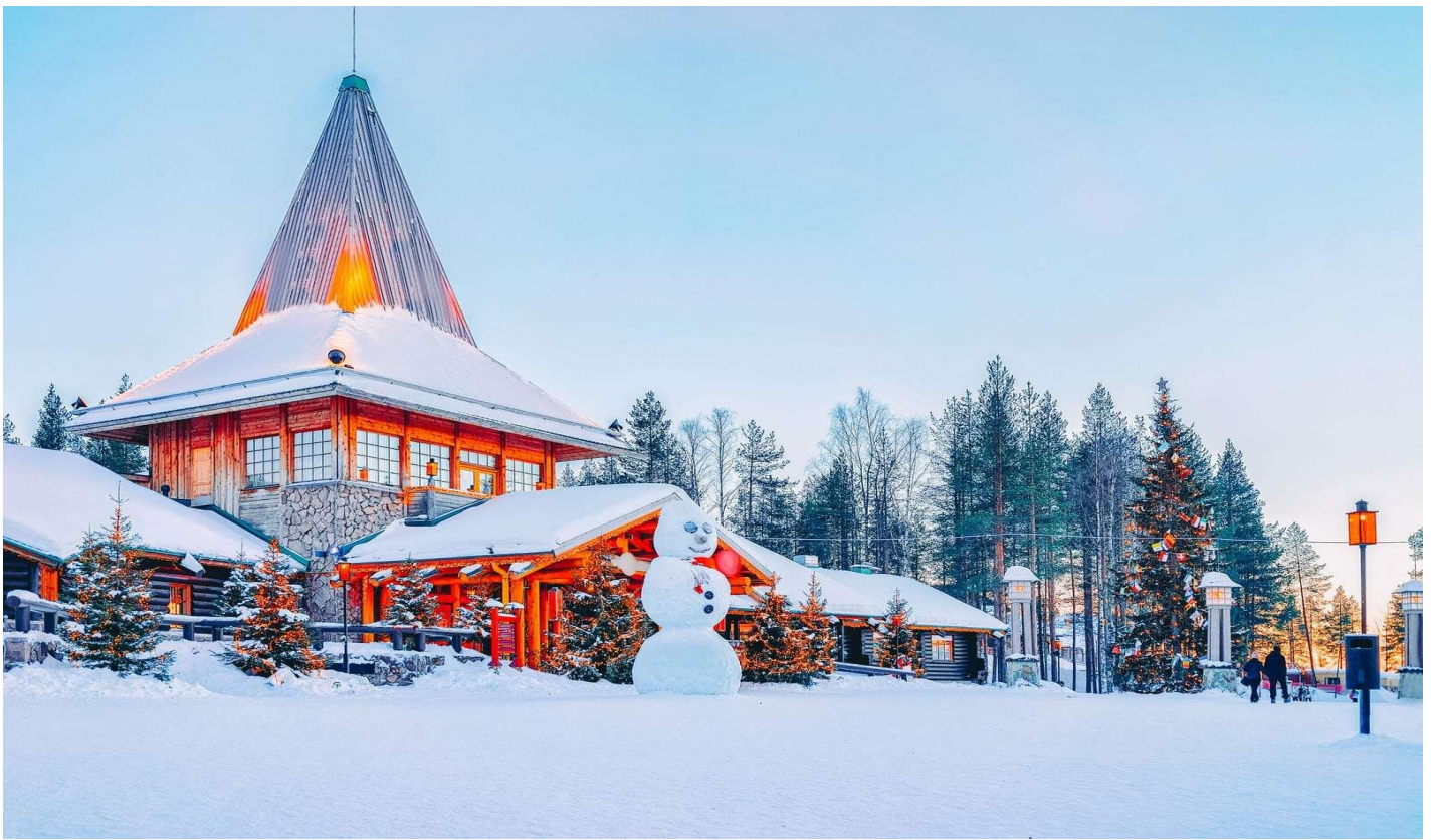
นำท่านถ่ายรูปกับลุงซานต้าคลอส (รูปถ่ายไม่รวมในค่าทัวร์)