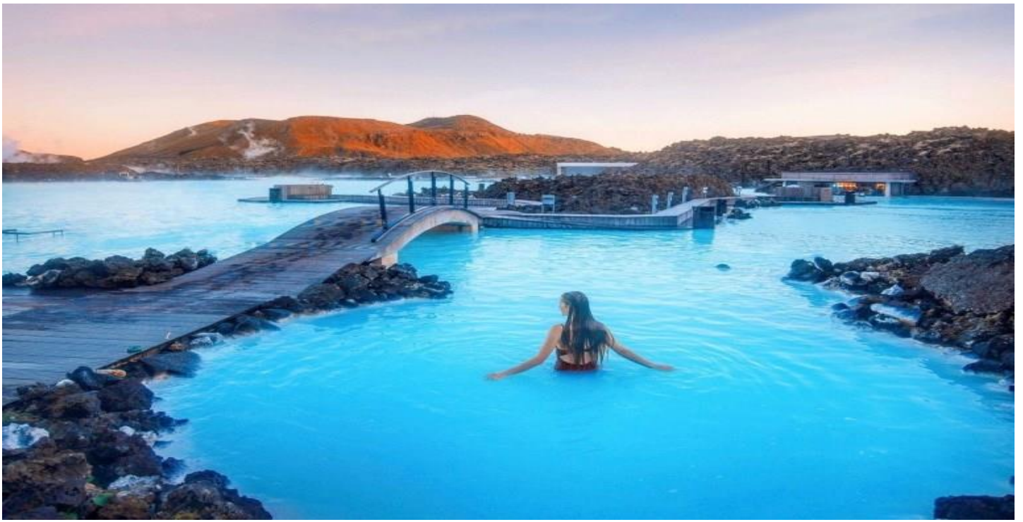
อิสระให้ทุกท่านผ่อนคลายและพักผ่อนตามอัธยาศัย