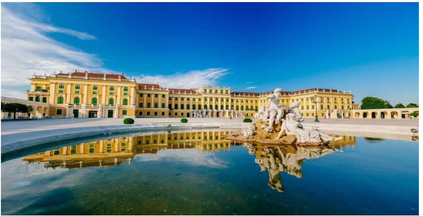
นำท่านชมด้านในของพระราชวังเชินบรุนน์ ซึ่งมีการตกแต่งไว้อย่างวิจิตรสวยงาม