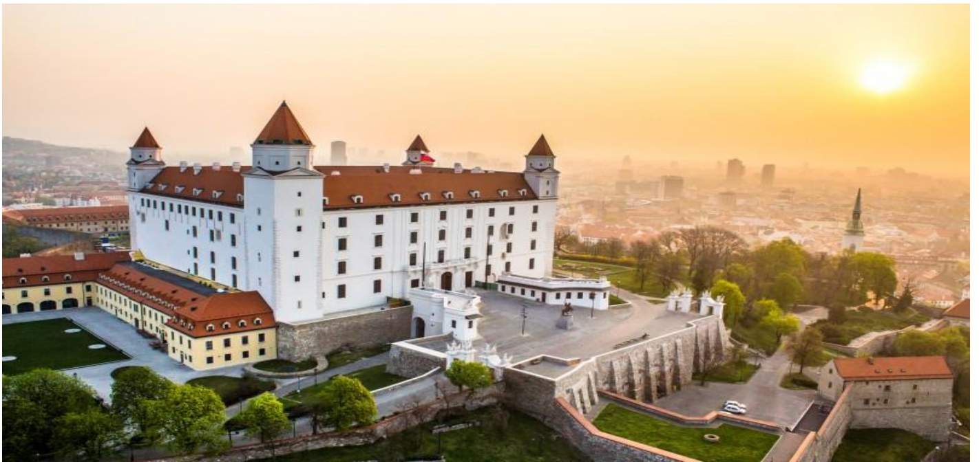
จากนำท่านชมเมืองในเขตจตุรัสใจกลางเมืองอันเป็นที่ตั้งของทำเนียบประธานาธิบดี