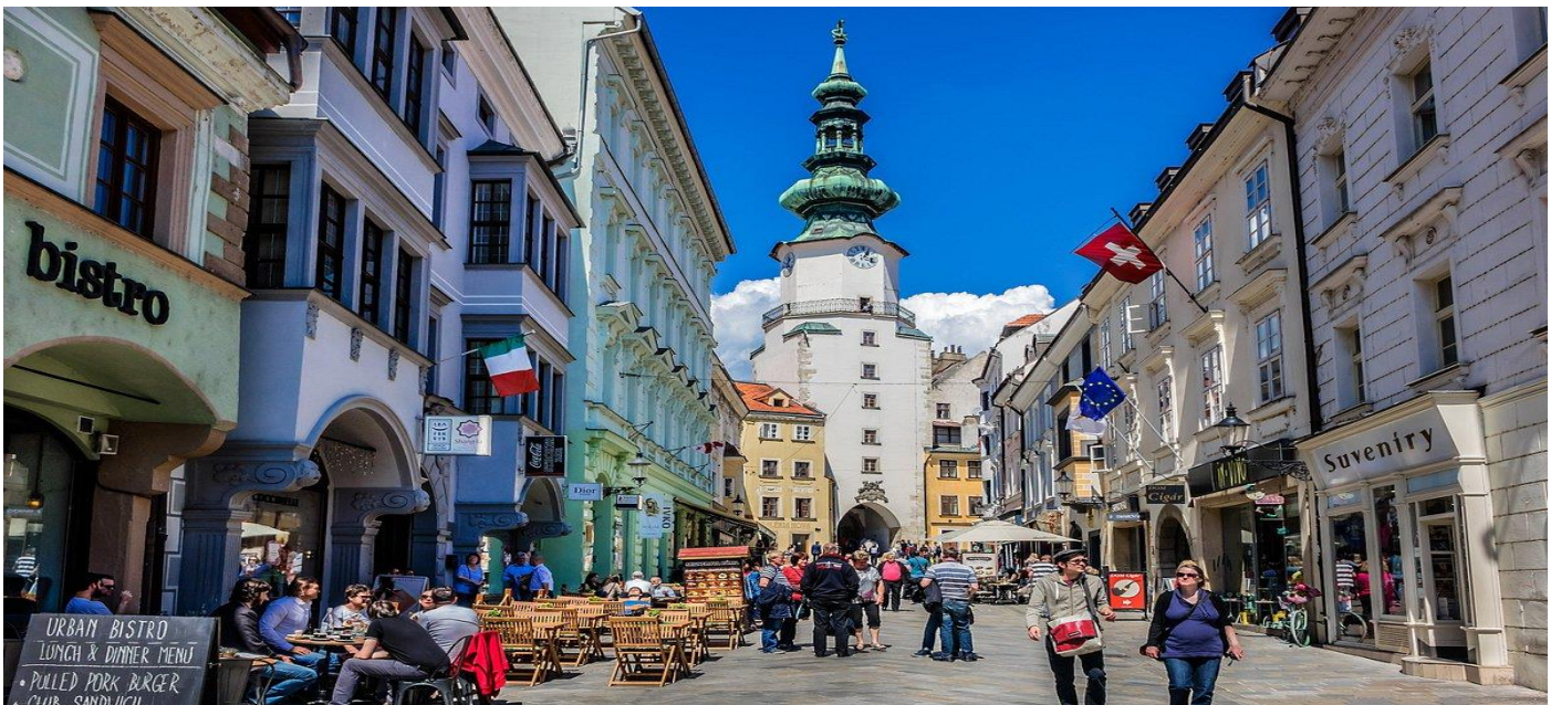
หรือเลือกซื้อสินค้าของที่ระลึกตามอัชยาศัย