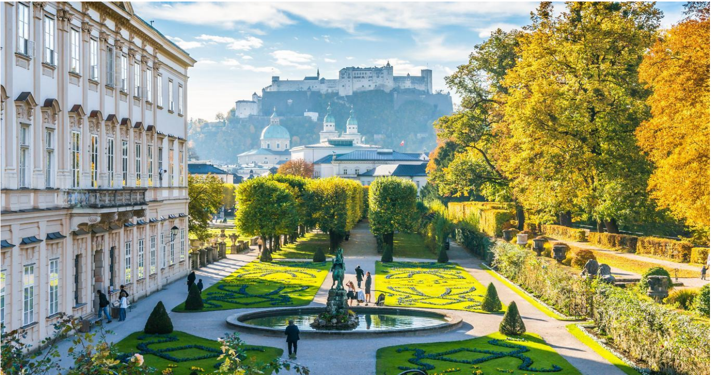
จากนั้นนำท่านข้ามแม่น้ำซาลส์ซัค ที่ไหลผ่านกลางตัวเมือง

นำท่านชม สวนมิราเบล (Mirabell Garden) ตั้งอยู่ที่เมืองซาลซ์บวร์ก (Salzburg) ภายในพระราชวังมิราเบล ภายในตกแต่งและออกแบบอย่างเป็นสัดส่วนในรูปแบบเรขาคณิตสไตล์บาโรก (baroque) เติมแต่งด้วยพันธุ์ไม้หลากสี อีกทั้งยังปรากฏรูปปั้นออตตาวิโอ มอสโต (Ottavio Mosto) รูปปั้นที่สะท้อนถึงองค์ประกอบ ดิน น้ำ ลม ไฟ อีกทั้งรูปปั้นคนตัวเล็กในสวนที่จำลองมาจากคนจริงในสมัย ค.ศ.1700 รวมถึงน้ำพุม้าปีกาซัส (The Pegasus Fountain) น้ำพุที่สะท้อนความเป็นยุโรปรวมถึงร่องรอยทางศิลปะที่โดดเด่นและน่าหลงใหล เป็นสวนที่สวยงามและเลื่องชื่อที่เป็นหนึ่งในฉากของภาพยนตร์สุดคลาสสิกอย่าง The Sound Of Music