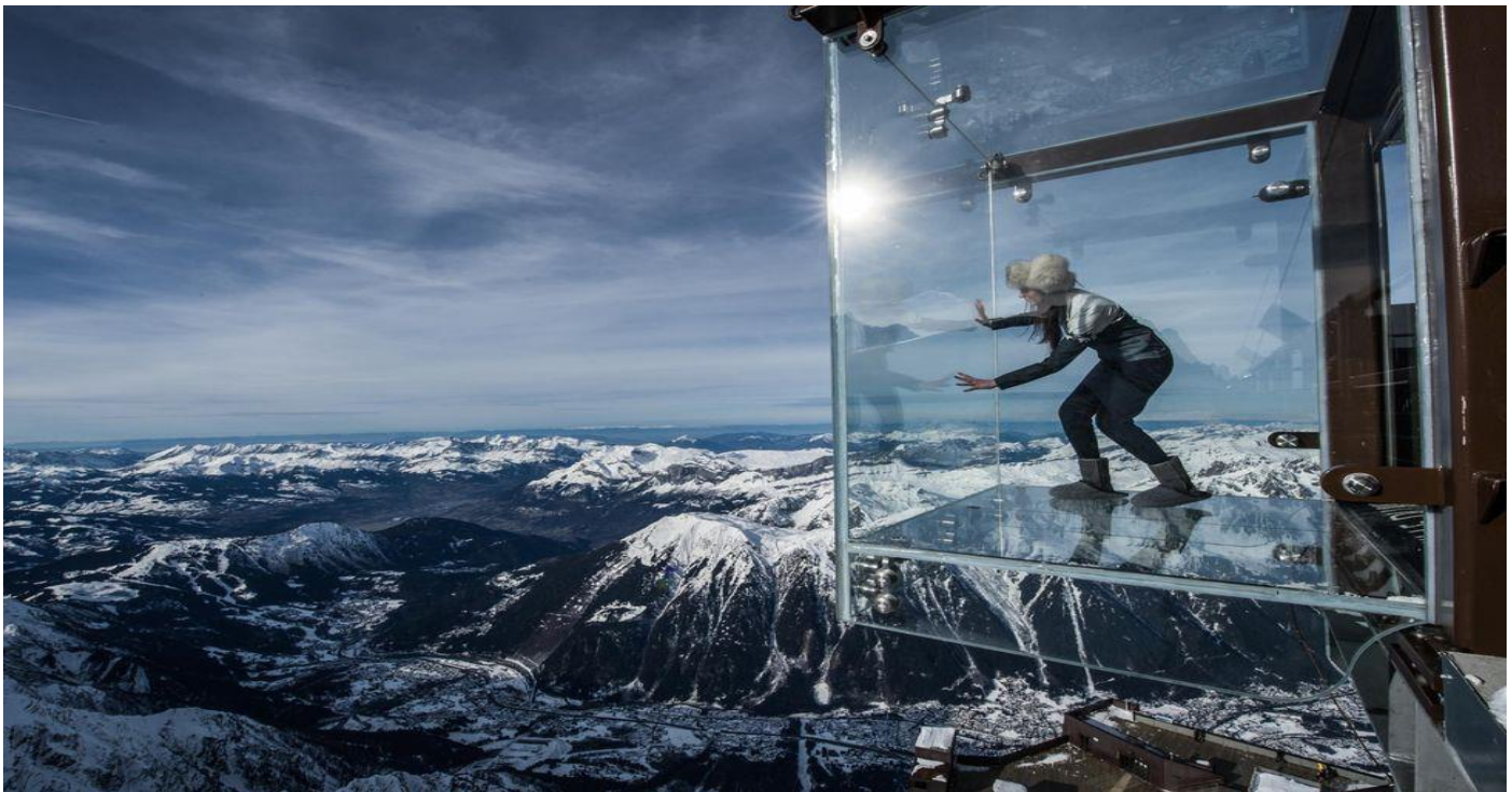
จากนั้นได้เวลาอันสมควรนำท่านเดินทางกลับสู่ด้านล่างเมืองชาโมนิกซ์