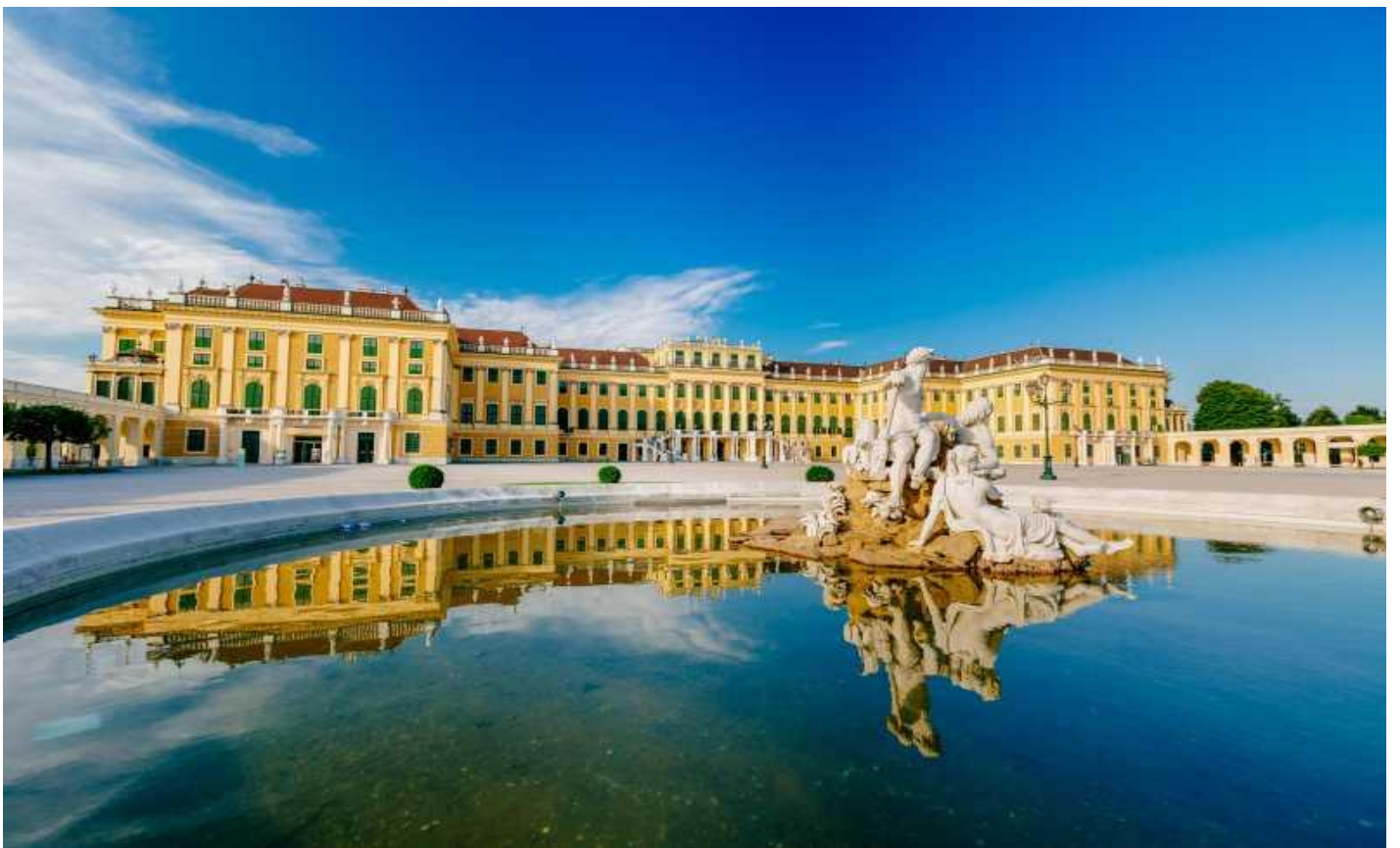
นำท่านชมด้านในของพระราชวังเชินบรุนน์ ซึ่งมีการตกแต่งไว้อย่างวิจิตรสวยงาม