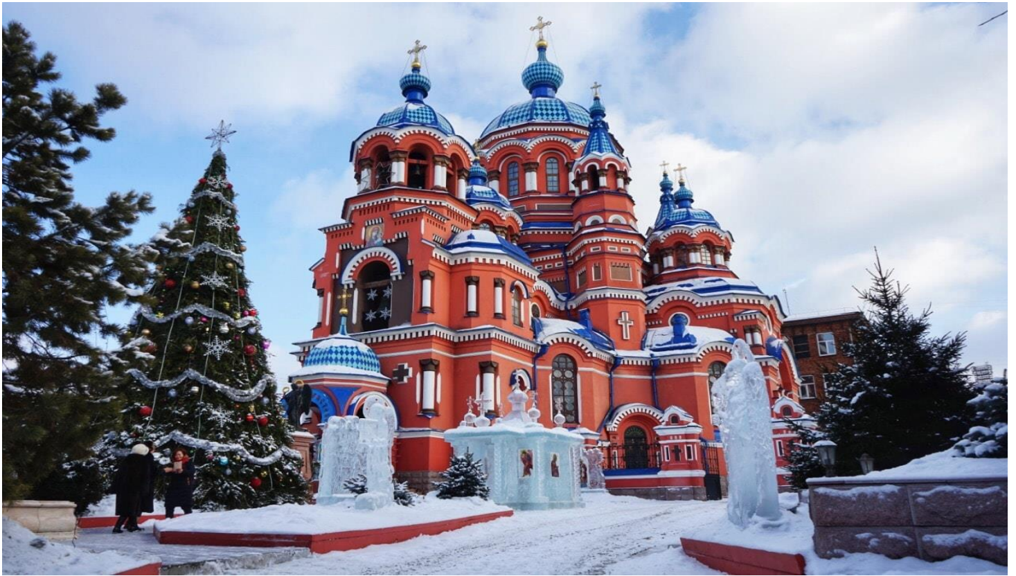
นำท่านถ่ายรูปกับ THE BABR MONUMENT เป็นรูปปั้นเสือไซบีเรียนคาบพังพอนแดง (SCARLET SABLE) สัญลักษณ์ของเมืองอิร์คุตสค์