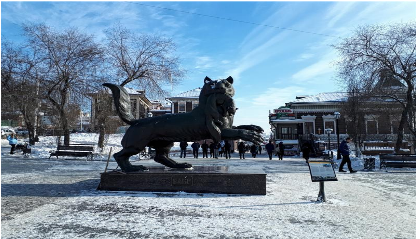
จากนั้นเชิญท่านอิสระช้อปปิ้ง ณ 130 คوارเตอร์ (130 Quarter) ย่านนี้นับว่าเป็นแหล่งท่องเที่ยวที่พลาดไม่ได้สำหรับผู้มาเยือนเมืองนี้ บริเวณนี้เป็นแหล่งรวมของร้านอาหาร บาร์ ร้านจำหน่ายของที่ระลึกที่ทันสมัย โดยสิ่งปลูกสร้างทั้งหมดบริเวณนี้สร้างด้วยไม้ และตกแต่งอย่างสวยงาม มีเอกลักษณ์