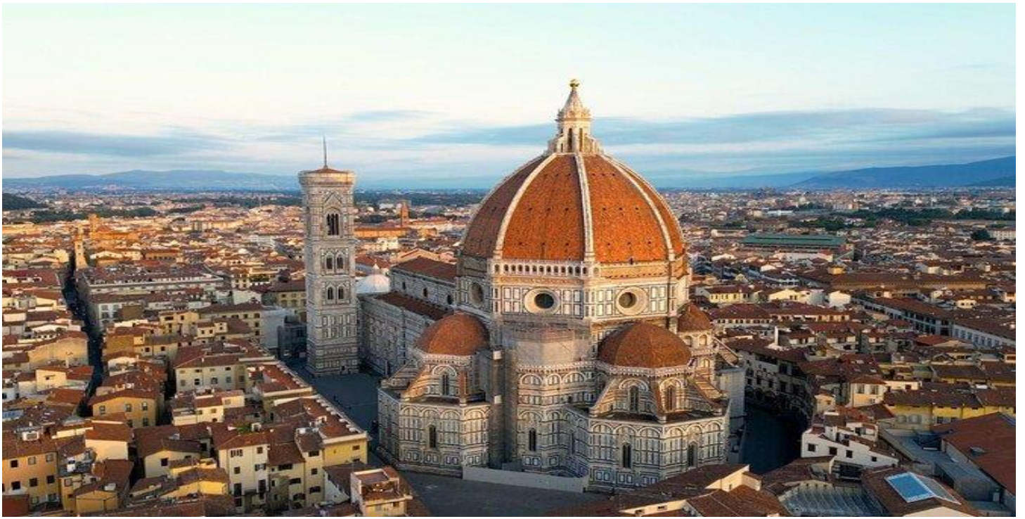
ภายนอกอาคารสร้างด้วยหินอ่อนสีขาวและเป็นผลงานทางสถาปัตยกรรมแบบโกธิค