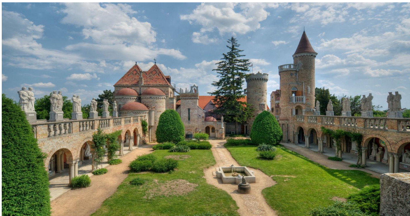
จากนั้นนำท่านเดินทางสู่ Varoshaz Square ซึ่งถือได้ว่าเป็นจุดศูนย์กลางของเมือง เป็นหนึ่งใน สถานที่ที่ยิ่งใหญ่ที่สุดของสถาปัตยกรรมบาโรกของฮังการี โดยจตุรัสแห่งนี้จะล้อมรอบด้วย พระราชวังและที่อยู่อาศัยสไตล์บาโรกจากศตวรรษที่ 17 และ 18 มีเวลาให้ท่านสัมผัสความ งดงามของเมืองนี้ตามอัธยาศัย