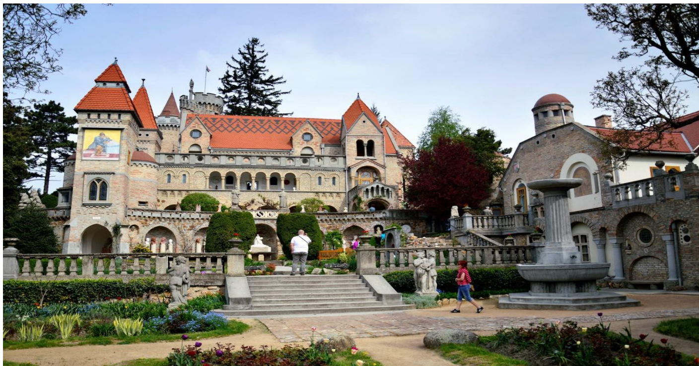
ผ่านชม Bishop's Palace ซึ่งเป็นคฤหาสน์ที่มีสถาปัตยกรรมสไตล์ บาร็อค โดยคฤหาสน์ ได้ ก่อสร้างขึ้นเมื่อปี ค.ศ. 1801