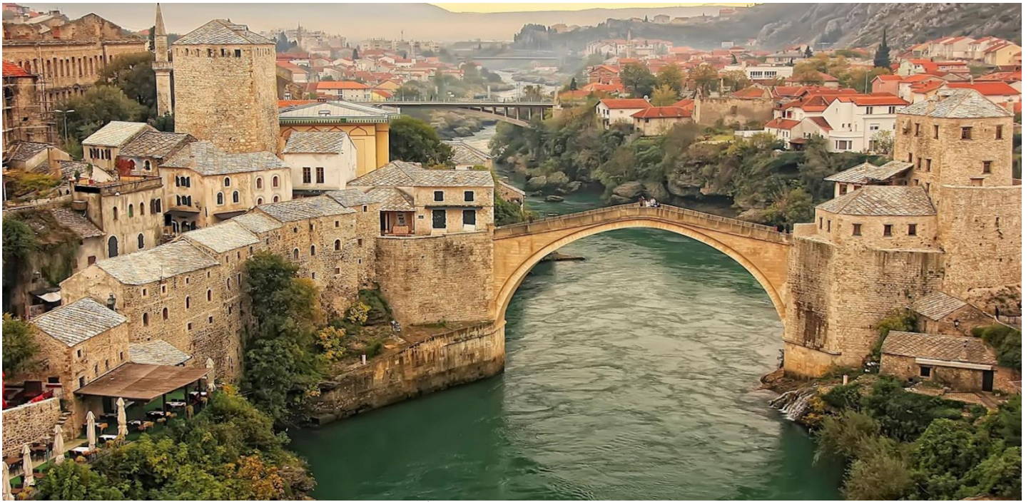
อิสระให้ท่านเดินชมเมืองเล็กชื่อกษेत्रที่ระลึก ตามอัชยาศัย