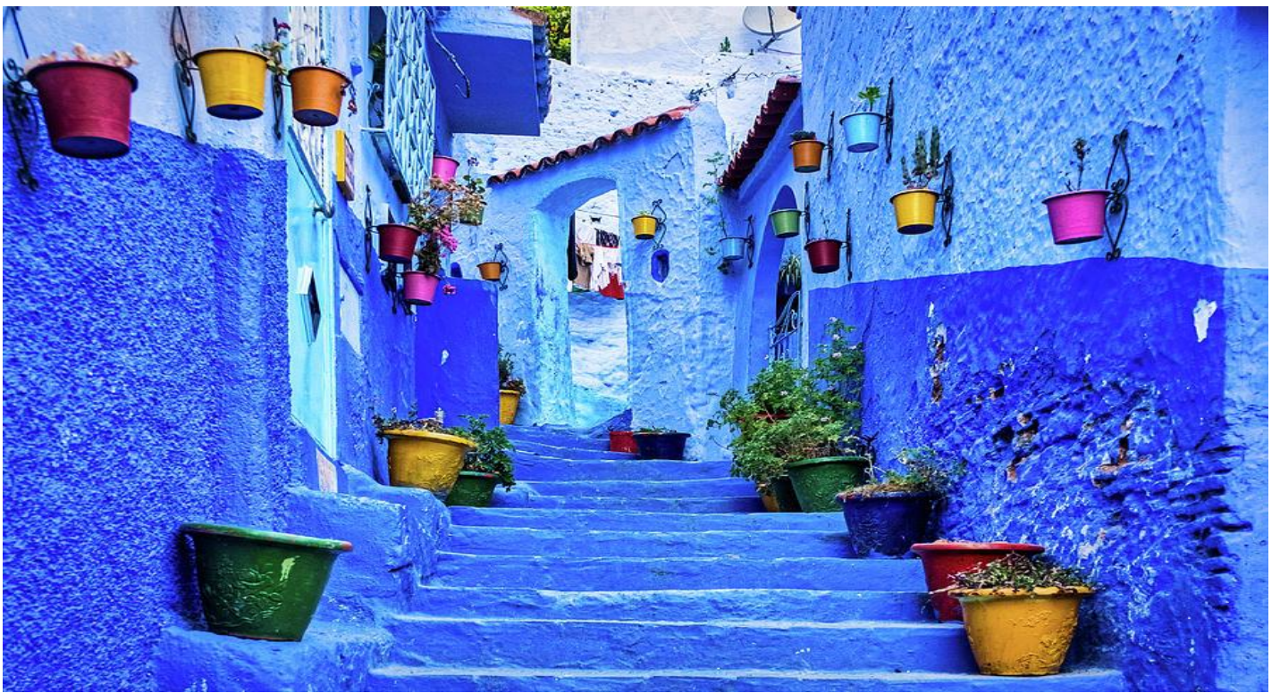
อิสระให้ท่านเดินถ่ายรูปตามอัชยาศัย