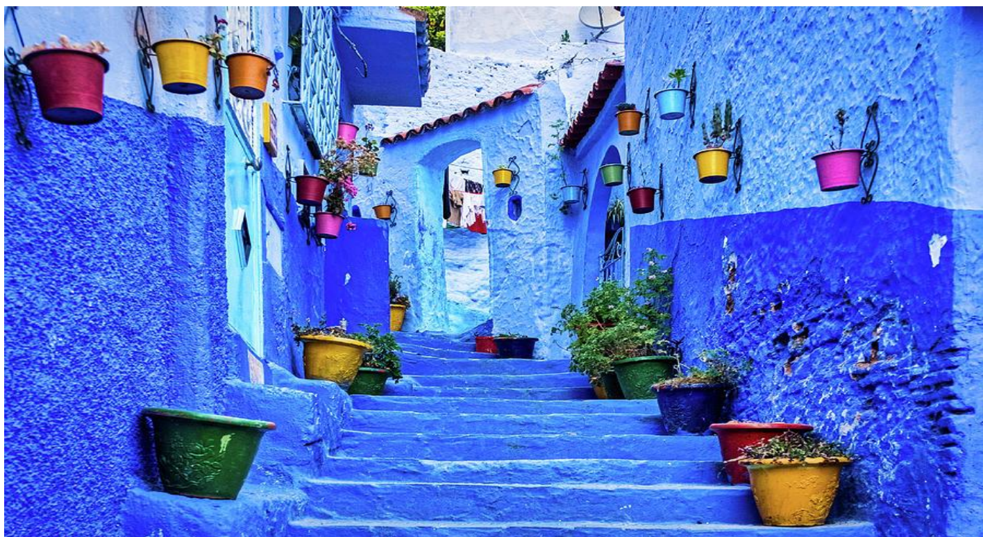
อิสระให้ท่านเดินถ่ายรูปตามอัชยาศัย