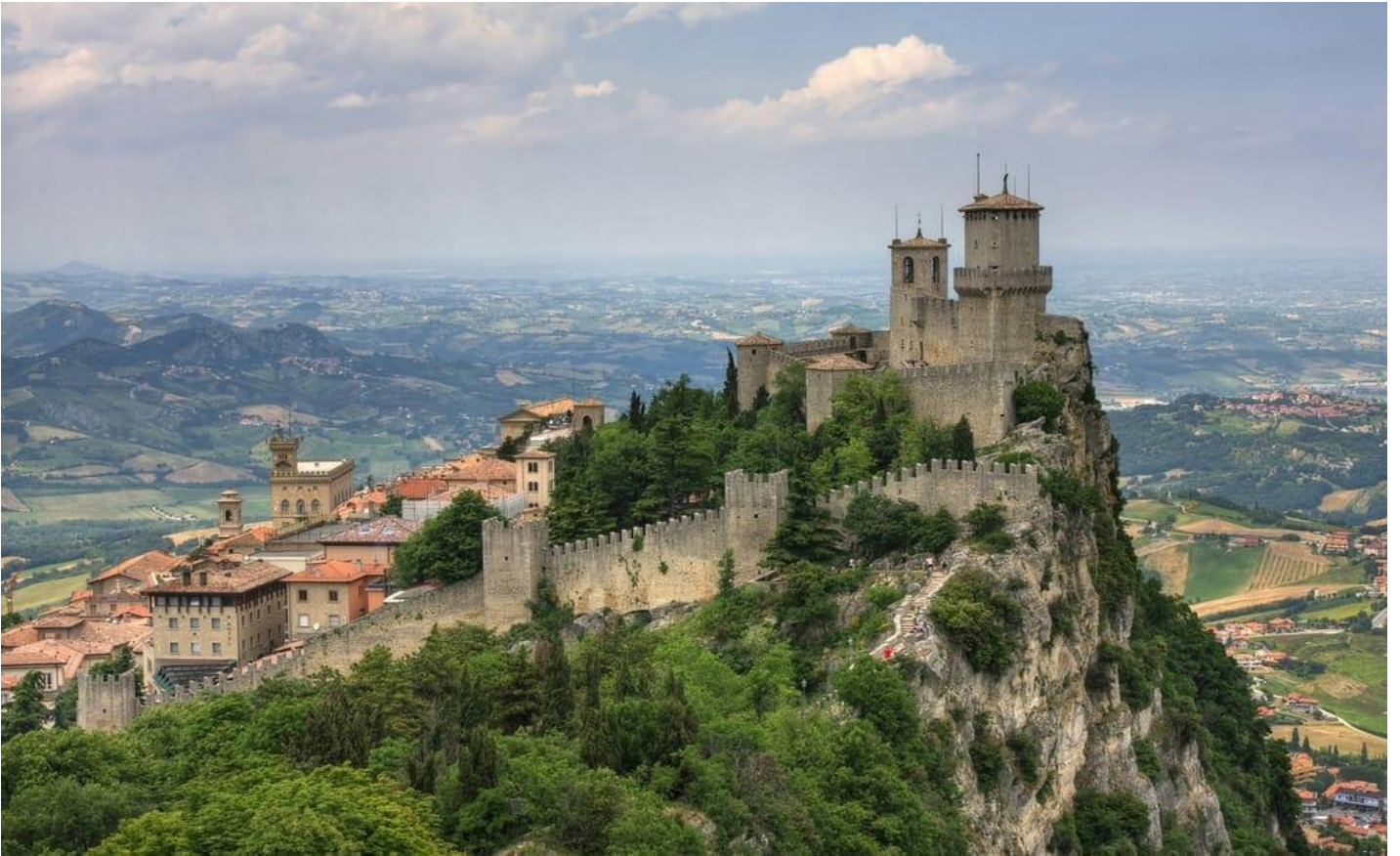
จากนั้นนำท่านนั่ง CABLE CAR ขึ้นสู่ยอดเขาอัฟเพนนินี ที่ตั้งของเมืองซาน มารีโน