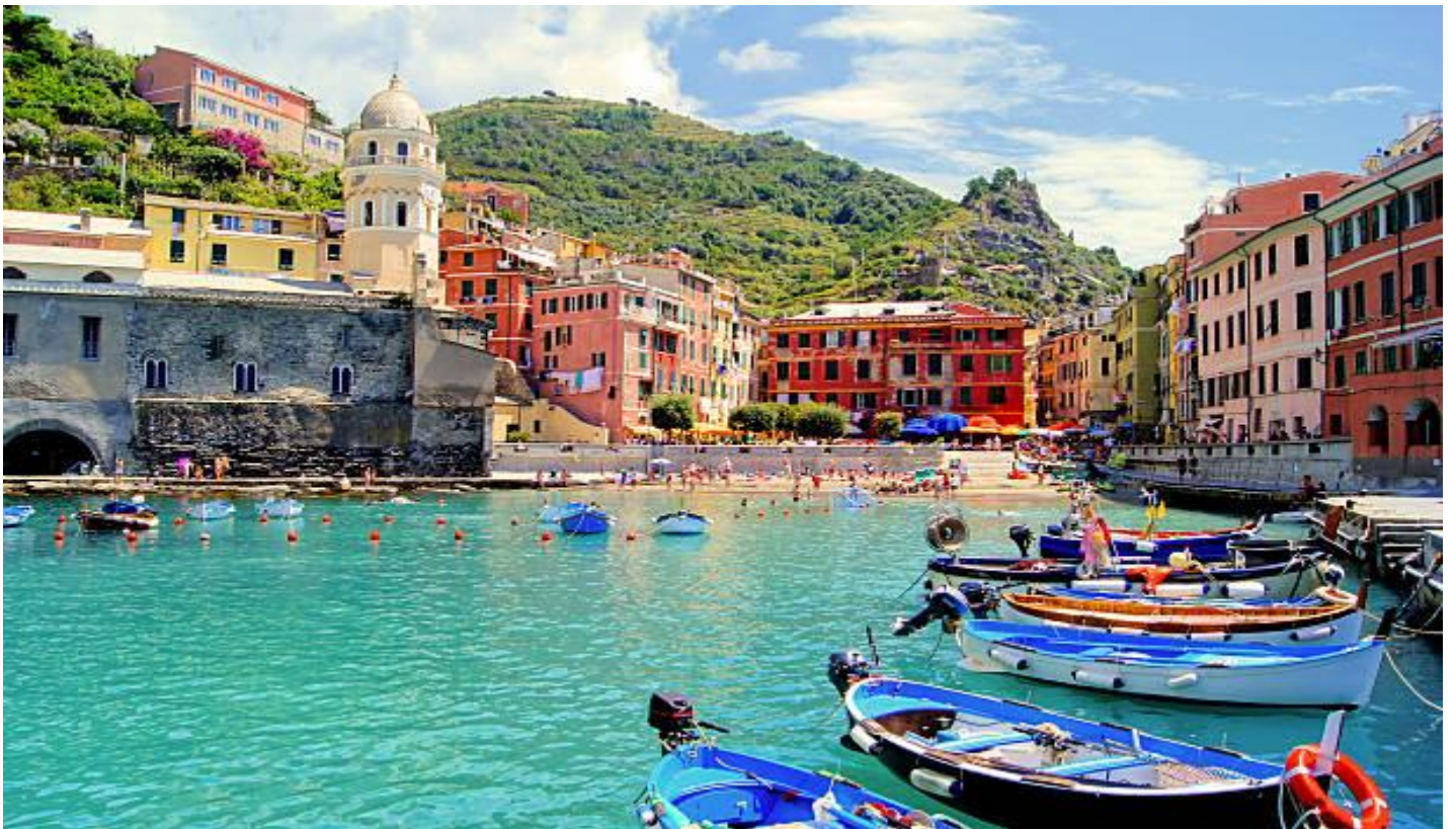
หมู่บ้าน RIOMAGGIORE