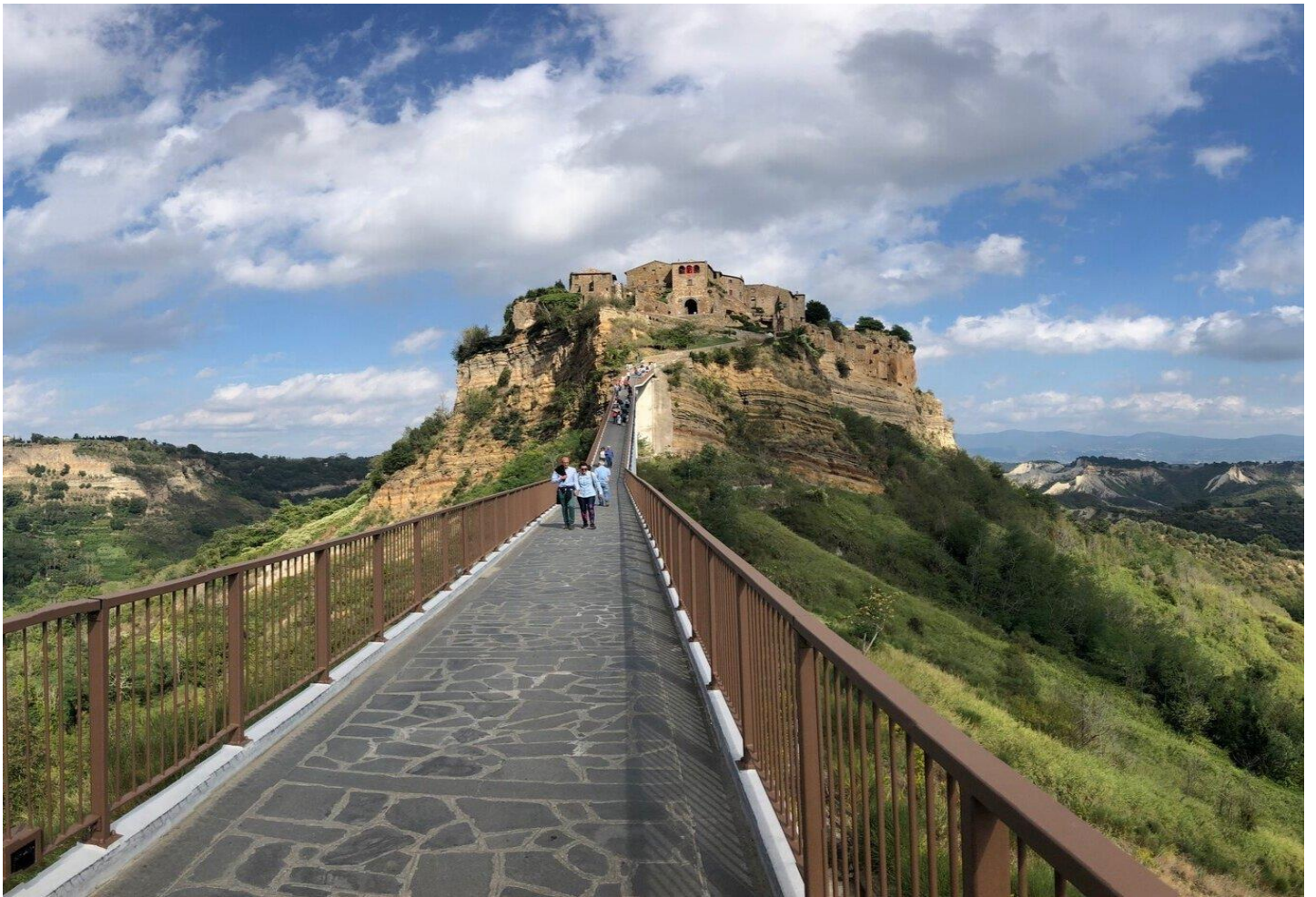
อิสระให้ท่านเดินเล่นชมเมืองตามอัธยาศัย