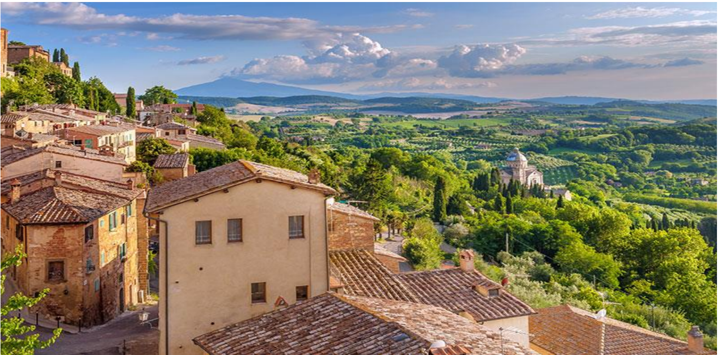
นำท่านเดินเล่นเมืองมอนเตปุลเซียโน

จากนั้นนำท่านเดินทางสู่เมือง มอนเตปุลเซียโน (Montepulciano) (ระยะทาง 15 กม. ใช้เวลาประมาณ 25 นาที) เป็นเมืองที่มีความสวยงามอีกแห่งของทัสคานี ตั้งอยู่บนเนินเขาในจังหวัดเซียนาของอิตาลีทางตอนใต้ ที่นี่เป็นเมืองยุคกลางที่เต็มไปด้วยพระราชวังยุคเรเนสซองส์ที่สง่างาม โบสถ์โบราณจัตุรัสที่มีเสน่ห์ และมุมมองที่สวยงามโดยมีทัศนียภาพกว้างไกลของหุบเขา Val d'Orcia และหุบเขา Val di Chiana ล้อมรอบ เมือง Montepulciano ได้รับความสนใจอย่างมาก เพราะเป็นหนึ่งในสถานที่ถ่ายทำภาพยนตร์อันโด่งดัง เรื่อง Twilight: New Moon ทำให้มีนักท่องเที่ยวเดินทางมาตามรอยกันอย่างคึกคัก นอกจากทัศนียภาพอันน่าทึ่งของเมืองชนบทโดยรอบที่ปกคลุมไปด้วยไร่องุ่นแล้ว เมืองแห่งนี้ก็มีชื่อเสียงด้านอาหารการกิน ขึ้นชื่อในเรื่องเนื้อหมู ชีส พาสต้า น้ำผึ้ง และสิ่งที่เป็นที่รู้จักไปทั่วโลก ก็คือ ไวน์ Montepulciano ซึ่งถือเป็นหนึ่งในไวน์ชั้นเลิศของอิตาลี