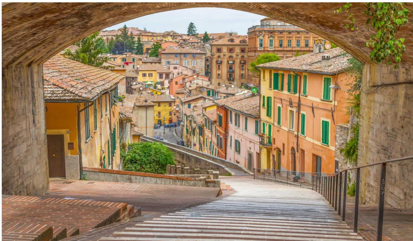
อิสระให้ท่านเดินชมเมืองตามอัชฌาศัย

ตั้งแต่ต้นศตวรรษที่14 อายุกว่า600ปี เป็นเมืองมีประวัติศาสตร์ที่ยาวนานและครอบคลุมหลายยุคสมัย โบสถ์และอาคารล้วนงดงามด้วยศิลปะการผสมผสานระหว่างยุค โกธิคและเรเนซองส์