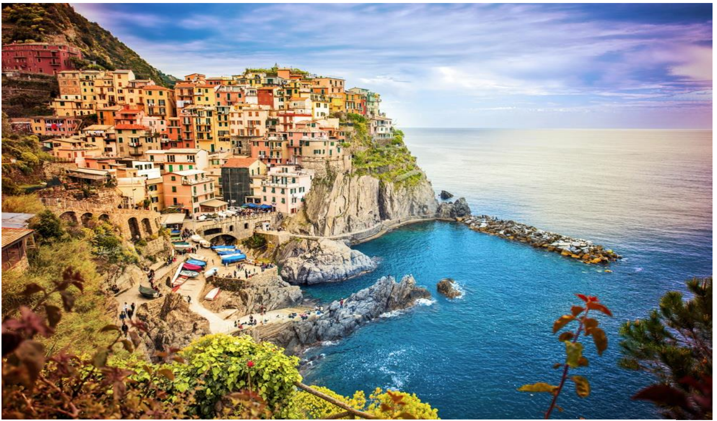
กลางวัน รับประทานอาหารกลางวัน ณ ภัตตาคารอาหารพื้นเมือง หมู่บ้าน VERNAZZA