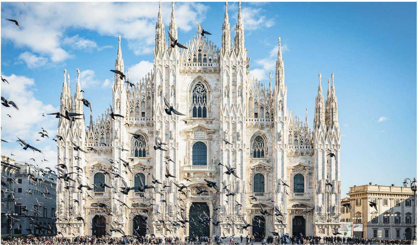
อิสระให้ทุกท่านช้อปปิ้งเลือกซื้อสินค้าตามอัธยาศัย